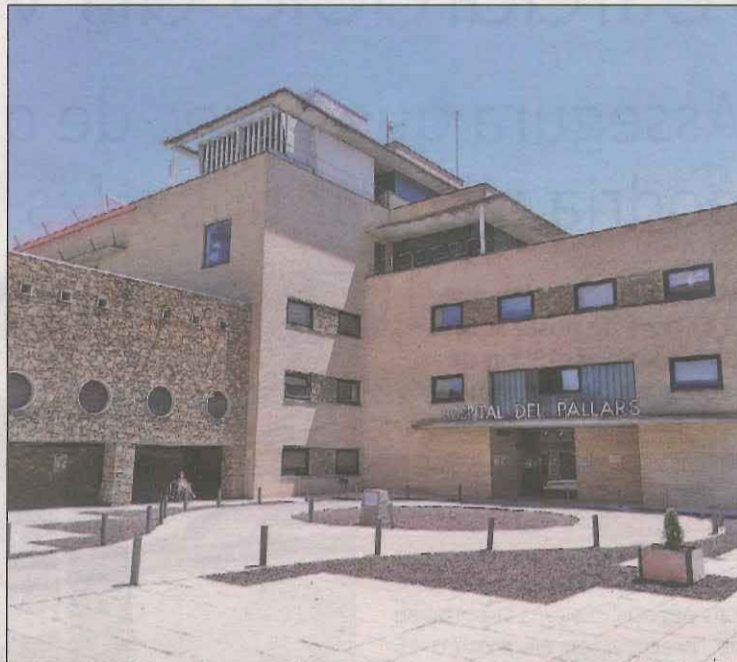
Entrada de l'Hospital Comarcal del Pallars a Tremp

Per la seva banda, l'Ajuntament de la Pobla de Segur, al Pallars Jussà, va recomanar, a través d'un BAN informatiu, a la població que intensifiqui les mesures de prevenció.