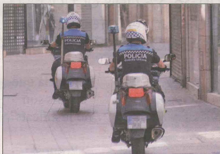
El bar està situat al carrer Llitera

D'altra banda, els Mossos d'Esquadra van denunciar durant el passat cap de setmana a tres restaurants de les comarques de les Garrigues i el Pla d'Urgell per incomplir les mesures anti Covid. A Juneda, es va denunciar un dels restaurants per servir a la barra;