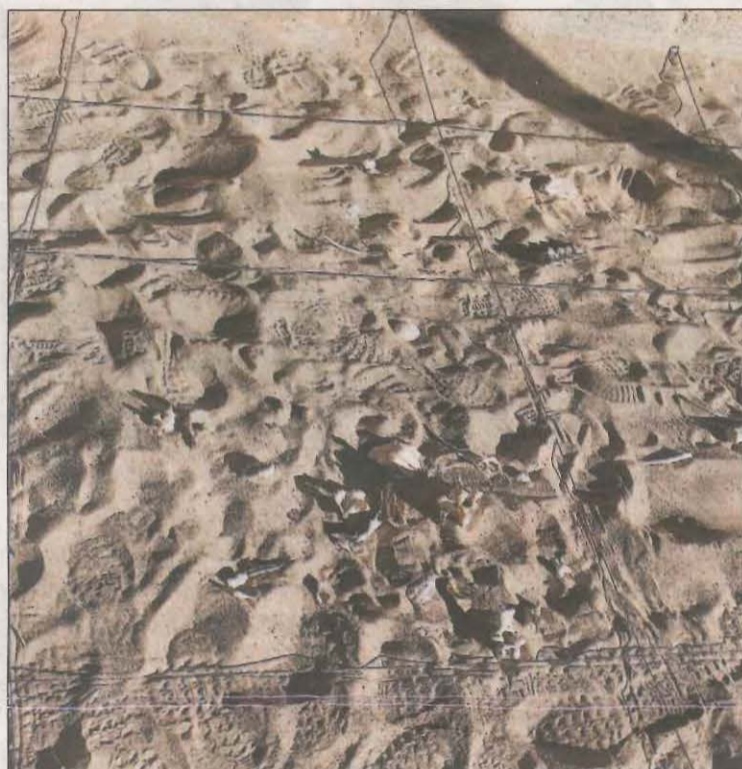
FOTO: Espai Orígens / Imatge de les destrosses i brutícia ocasionades

En el comunicat, també apunten que han denunciat els fets perquè "posen en perill l'ús i manteniment d'unes instal·lacions que són un equipament cultural en el qual es desenvolupen activitats relacionades amb la prehistòria i el patrimoni, de les quals són usuaris molts joves durant el curs escolar" i afegixen que "comporten un greu dete-