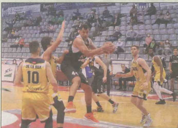
El Barris Nord acogió un centenar de aficionados

El ICG Força Lleida cogió aire ayer con su victoria ante el colista Real Canoe en el Barris Nord. Los leridanos recuperaron efectivos y pudieron brindar el triunfo al centenar de espectadores que asistieron al partido, en lo que significó el regreso de aficionados al Barris Nord. DEPORTES | PÁG. 25-26