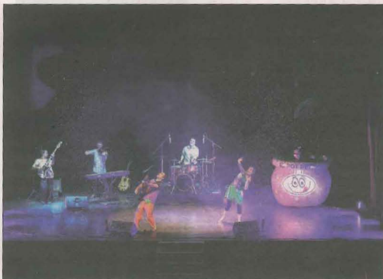
El Pot Petit ja va actuar a Balaguer el 2018

al matí, s'ha decidit per un altre concert que se celebrarà a les 12.00 hores. El Pot Petit al Teatre és un concert recomanat especialment a infants de 3 a 8 anys que explica la història de la Jana, en Pau i la Melmelada Band, amb nou músics dalt l'escenari, titelles i teatre per gaudir en família. L'espectacle tanca el 2n cicle d'hivern Emborats 2021.