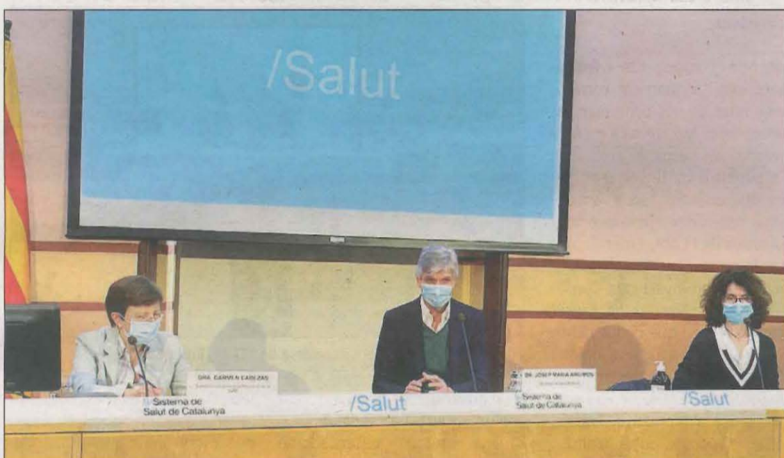
Els responsables de Salut diuen que "no hi ha cap vacuna que no tingui efectes adversos"

Això representa un 57,8% dels treballadors essencials amb la primera dosi i, per tant, que prop de la meitat hauran d'esperar l'informe de l'Agència Europea del Medicament (EMA), segons dades facilitades per Salut en roda de premsa. Paral·lelament es continua vacunant amb Pfizer i Moderna. De moment, han rebut vacuna 113.016 majors de 80 anys, un 28,4% (a part dels que viuen en residències). Sobre la situació epidemiològica, Salut va advertir ahir que la baixada de casos s'ha