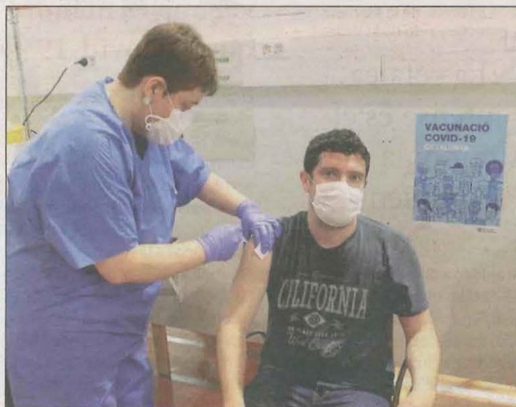
El 3,15% dels lleidatans ha rebut la vacuna d'AstraZeneca

La següent comarca on s'han inculat més vacunes d'AstraZeneca és a les Garrigues amb 543