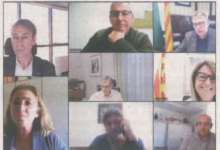
Reunió telemàtica del Patronat de Turisme

L'import de la subvenció per a cada consell comarcal serà de 20.000 euros excepte en el cas del de la Cerdanya, dividida en dues demarcacions, que serà de 10.000 euros. Per la seva banda, la Val d'Aran no figura entre els beneficiaris d'aquests ajuts, atès que la col·laboració en matèria turística es regeix pel conveni marc de col·laboració signat amb el Conselh Generau d'Aran i la Diputació de Lleida. Aquesta partida destinada als consells