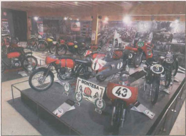
Algunes de les motocicletes que s'hi poden veure