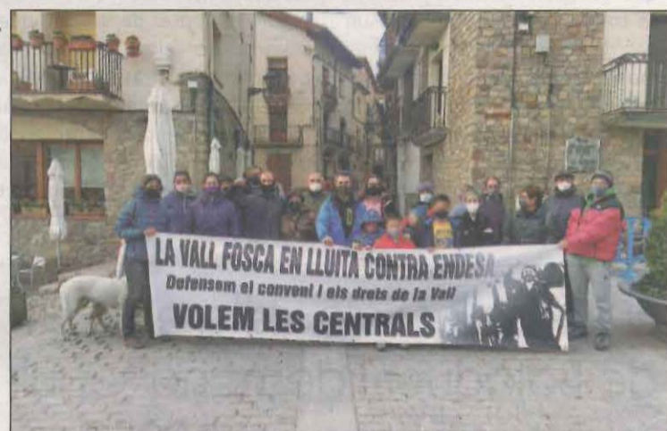
Els veïns es van manifestar pels carrers de Pobleta de Bellví

La CUP ha interposat una denúncia contra els tinents d'alcalde de l'Ajuntament de la Torre de Capdella i contra el responsable d'ENDESA pels talls de llum de la Vall Fosca, després que la companyia hagi tallat el subministrament en període hivernal a diverses famílies per un deute pendent.