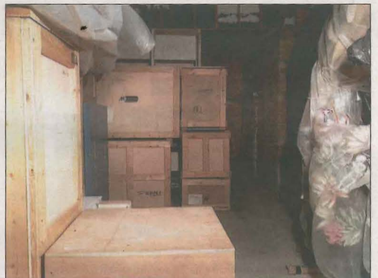
Les caixes on s'ha guardat la roba i els elements

De moment, el que han fet ha estat emmagatzemar part del material, com ara elements del muntatge i vestuaris, en caixes ignífugues cedides pel Museu de