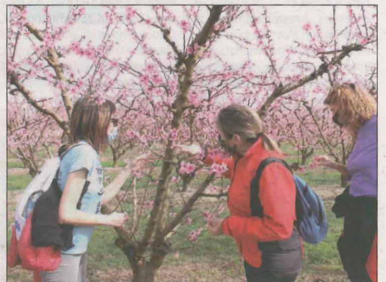
Imatge d'unes persones visitant els camps florits