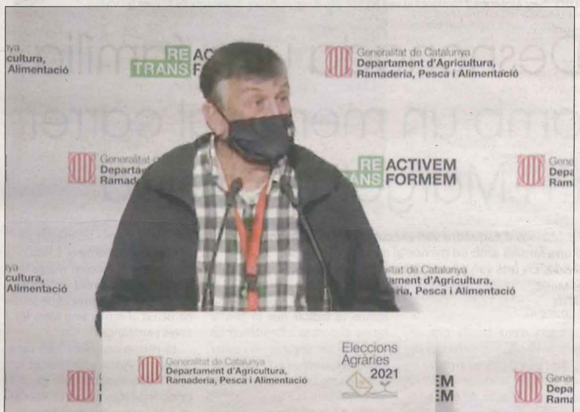
El coordinador d'Unió de Pagesos valorant els resultats dels comicis agraris

D'aquesta manera, UP obté 6 representants a la Taula Agrària i JARC, 4. Aquests són els resultats amb un escrutini provisional del 100% dels vots emesos. Dels 7.382 vots, 6.495 han estat de professionals autònoms i 887 d'empreses. D'altra banda, un 35% dels votants han optat per votar remotament i la resta ho han fet des d'algun dels 209 punts d'assistència al vot electrònic.