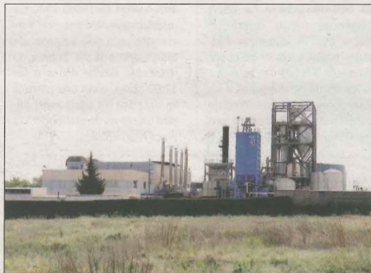
Imatge de les instal·lacions de Tracjusa

Des del govern del Consell Comarcal es veu amb preocupació la situació que es pugui generar amb l'entrada en funcionament de la nova planta de Tracjusa, en una zona que ja en l'actualitat es veu molt saturada d'emissions