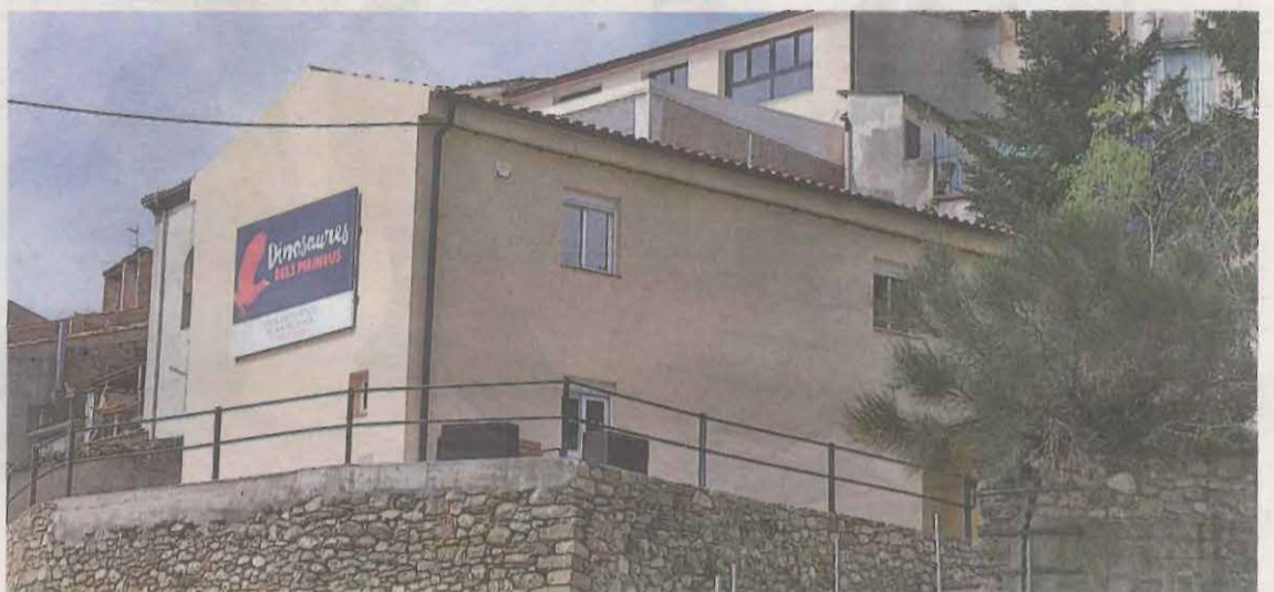
El Centre d'Interpretació del Montsec de Meià i dos dels fòssils que s'hi poden veure, un peix leptolepis i una fulla de falguera

da. Són com fotografies del passat, encastades en la pedra. Jaciments d'aquest tipus n'hi molt pocs al món i el nostre és una finestra als ecosistemes de l'època dels dinosaures, fa 125 milions d'anys. També és especial aquest museu perquè, més de 120 anys després que es recol·lectes el primer fòssil al Montsec, aquests es podran veure al propi municipi de la Pedrera. La col·lecció d'aquest jaciment abasta més de 8.000 fòssils que es troben repartits per museus i universitats catalanes i europees.