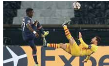
Messi, en el partit d'ahir

El Barça es llueix contra el PSG però només esgarrapa un empat (1-1) i no en fa prou per remuntar els vuitens de la Champions