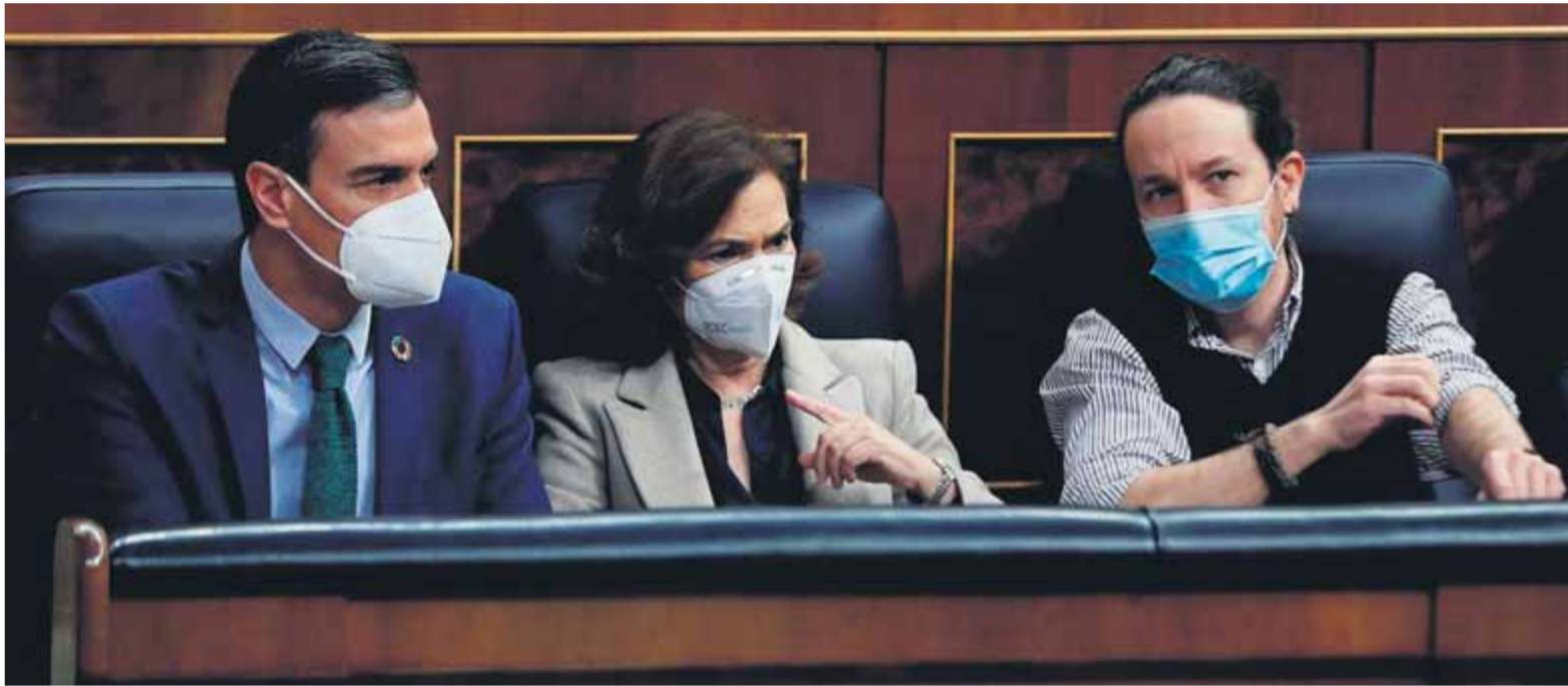
El president espanyol, Pedro Sánchez, acompanyat al Congrés dels seus dos vicepresidents, Carmen Calvo i Pablo Iglesias

■ Diu que si el suplicatori té el 50% de sí i no l'habitual 95% és pel conflicte ■ El PP insta Sánchez a expulsar-lo ■ Les eleccions a Madrid i l'aventura PSOE-Cs aïllen ERC i enverinen el camí de l'indult