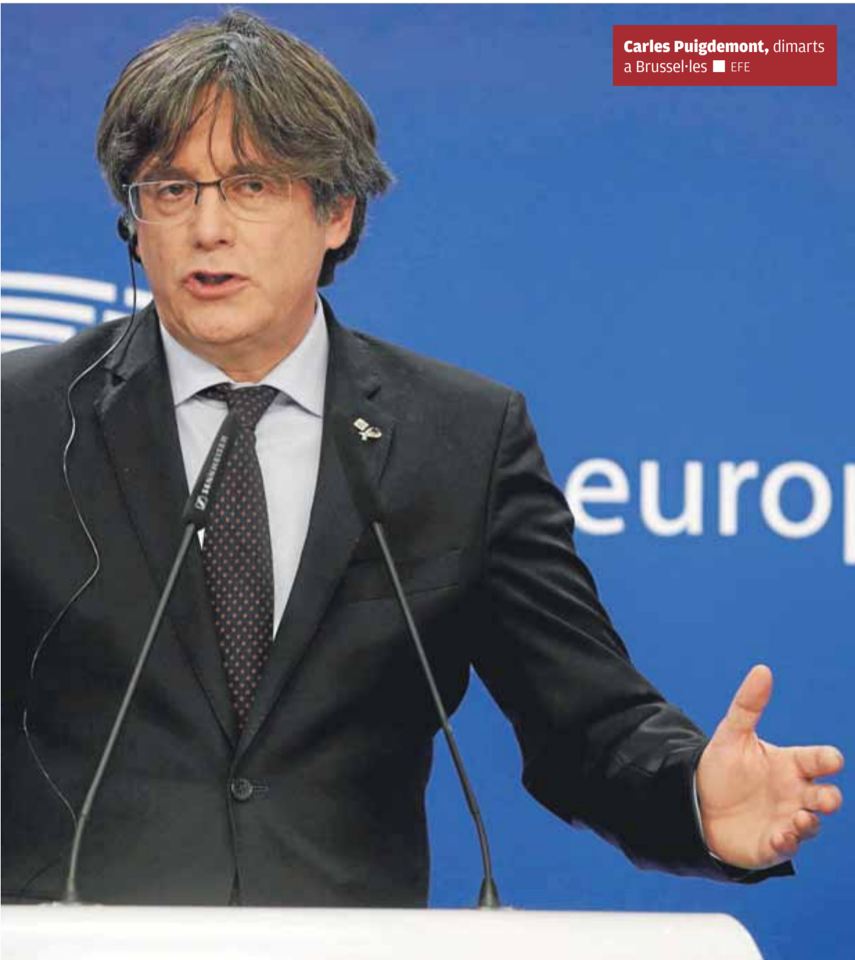
Carles Puigdemont, dimarts a Brussel·les