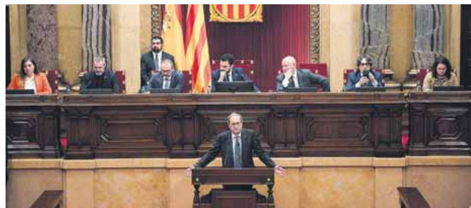
La mesa del Parlament durant l'anterior legislatura

La mesa presidida pel diputat de més edat decideix si accepta el vot telemàtic ■ Lluís Puig, exiliat, vol fer-ho així