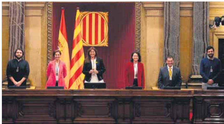
Els membres de la mesa del Parlament acabada de constituir

Es que hem llegit els dos volums de les memòries del president Carles Puigdemont escrites pel director d'aquest diari i les declaracions del president Quim Torra de dissabte passat en el programa FAQS no ens en vam sorprendre gens perquè era una repetició del que havia passat al president exiliat durant el seu mandat. Com que diuen que les imatges valen per mil paraules, sempre em fixo en un fet revelador: quan el govern va a reunir-se pel consell de govern, en la passejada que fan en el Pati dels Tarongers es formen dos grups i coincideixen sempre amb els seus respectius partits. Algú dirà que és ser molt primmirat, però la imatge m'evoca més l'entrada de dos governs que no la d'un. I ara hem sabut que el missatge no era tan erroni.