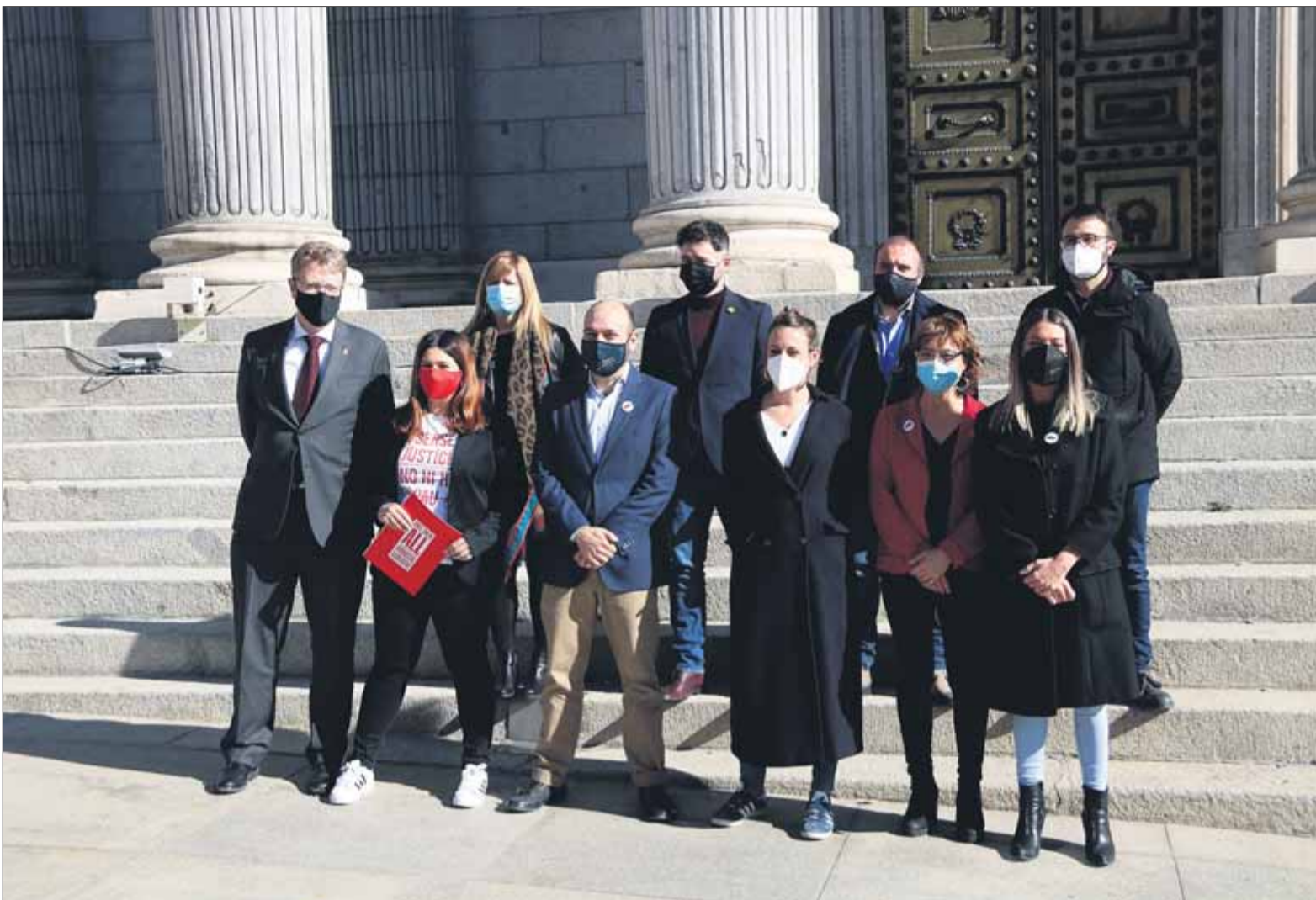
Els portaveus dels partits catalans amb representació al Congrés que ahir van subscriure la iniciativa en favor de l'amnistia