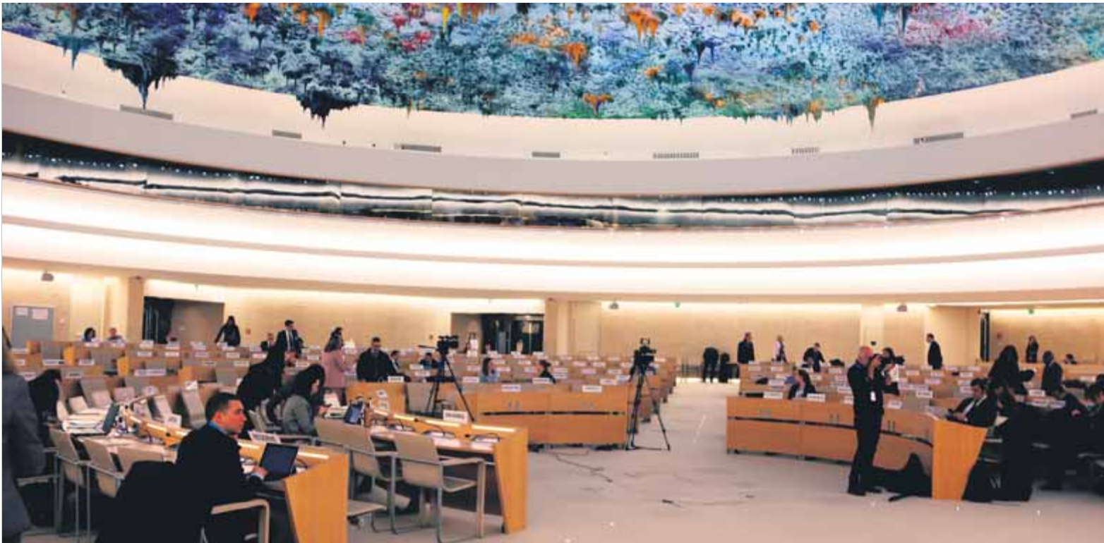
La seu del Consell de Drets Humans de l'ONU de Ginebra, en una imatge de principi d'aquest any