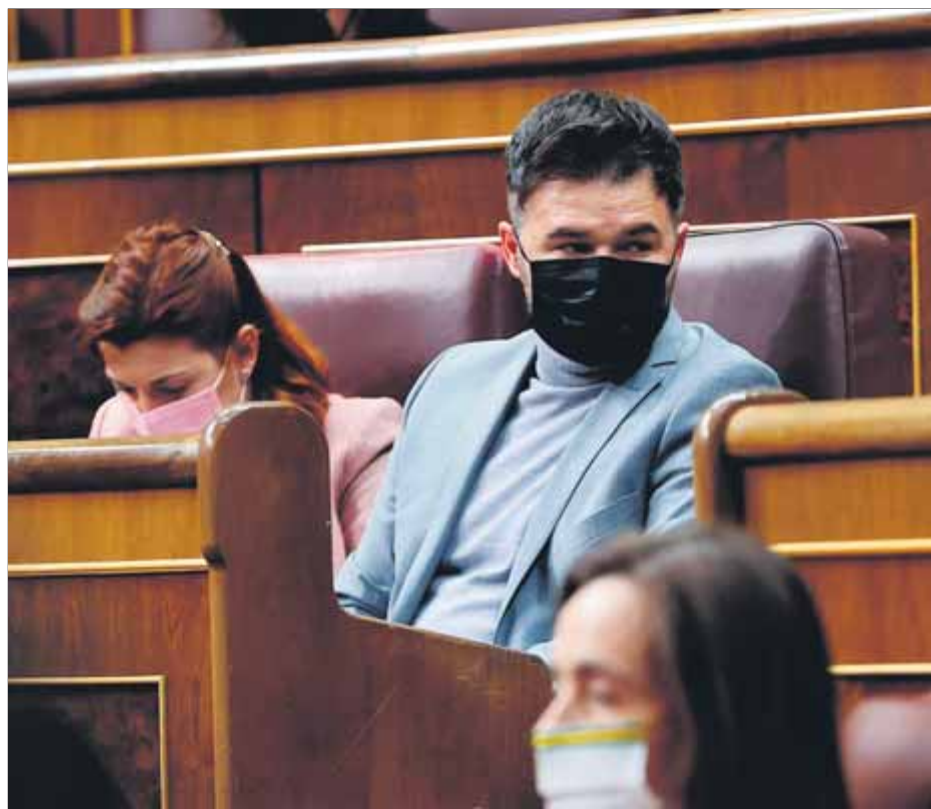
Gabriel Rufián, en una sessió recent al Congrés dels Diputats

Rufián s'acosta al sí i convalidarà el fons d'11.000 milions a empreses al Congrés ■ Nogueras s'hi oposa i Bel s'absté