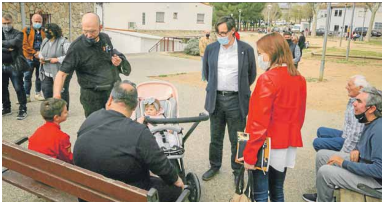
El parlamentari socialista, amb un grup de veïns del barri gironí de Vila-roja, ahir al migdia

bliques abans d'accedir a l'acte on es feia la presentació del llibre de Carme Forcadell. Aragonès va assegurar que per part d'ERC "no serà" que no s'arribi a un acord i va insistir que "encara hi ha temps" fins dimarts vinent. "Seguim treballant, seguirem treballant des d'ara i fins dimarts", va dir el vicepresident en funcions. Marta Vilalta, portaveu d'ERC i membre de l'equip negociador, no va assistir a l'acte. ■