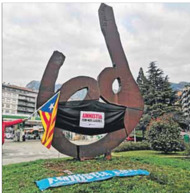
'La tramuntana', a Figueres; els avis de la plaça del Lledoner, de Granollers; el 'Monument a la Patum', a Berga, i el 'Jugador d'hoquei', a Puigcerdà, amb la mascareta