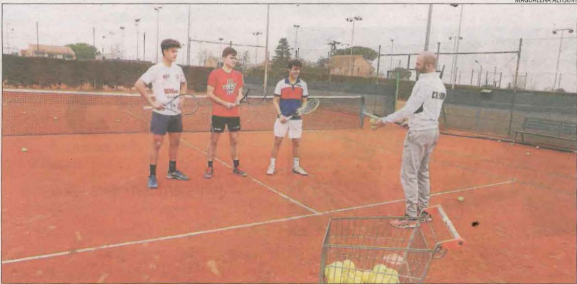
Alumnes de l'Escola de Tennis del CT Lleida, durant l'entrenament d'ahir.