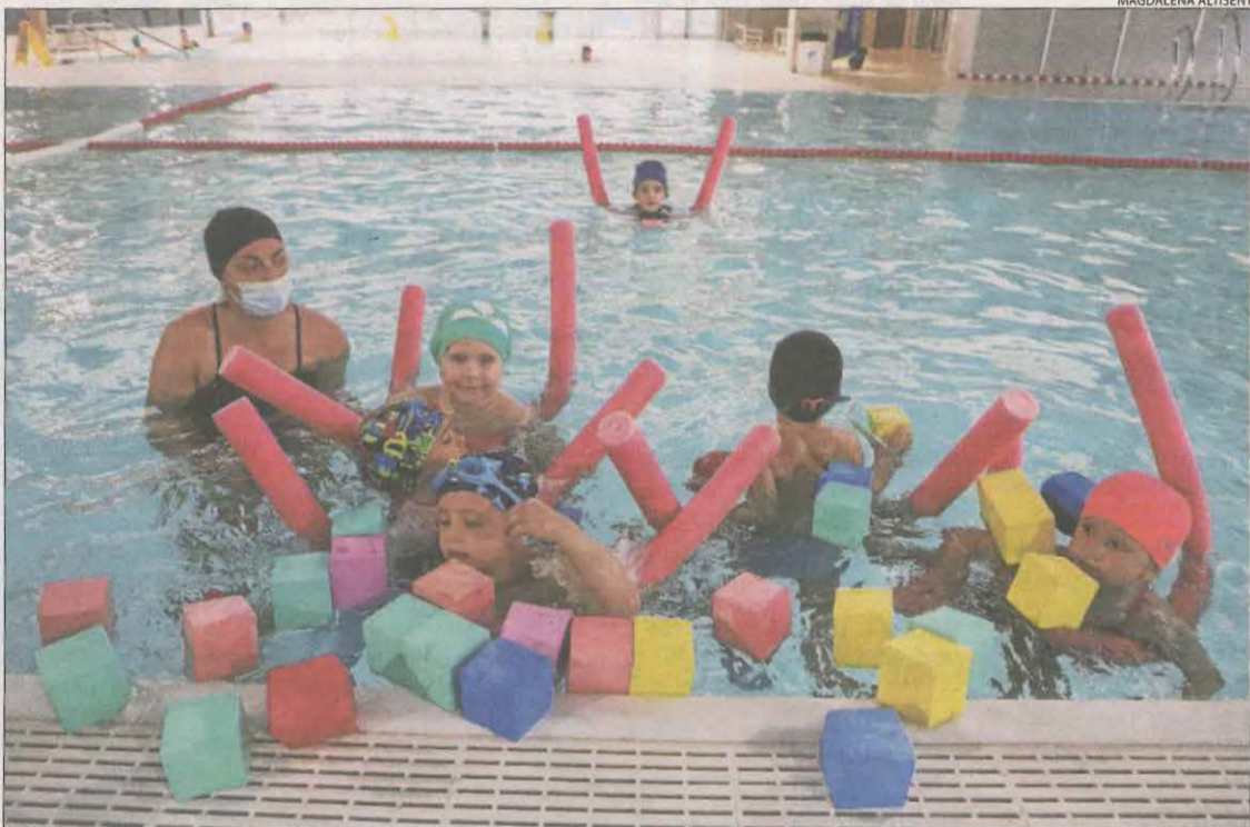
Un grup de nens, ahir a les instal·lacions del Trèvol.