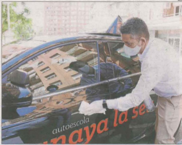
Desinfecció d'un cotxe d'autoescola en una foto d'arxiu.

Però no només els examinadors han hagut de fer-se PCR i complir quarantena, ja que també han hagut de fer-ho professors d'autoescoles i algun alumne que va tenir contacte amb