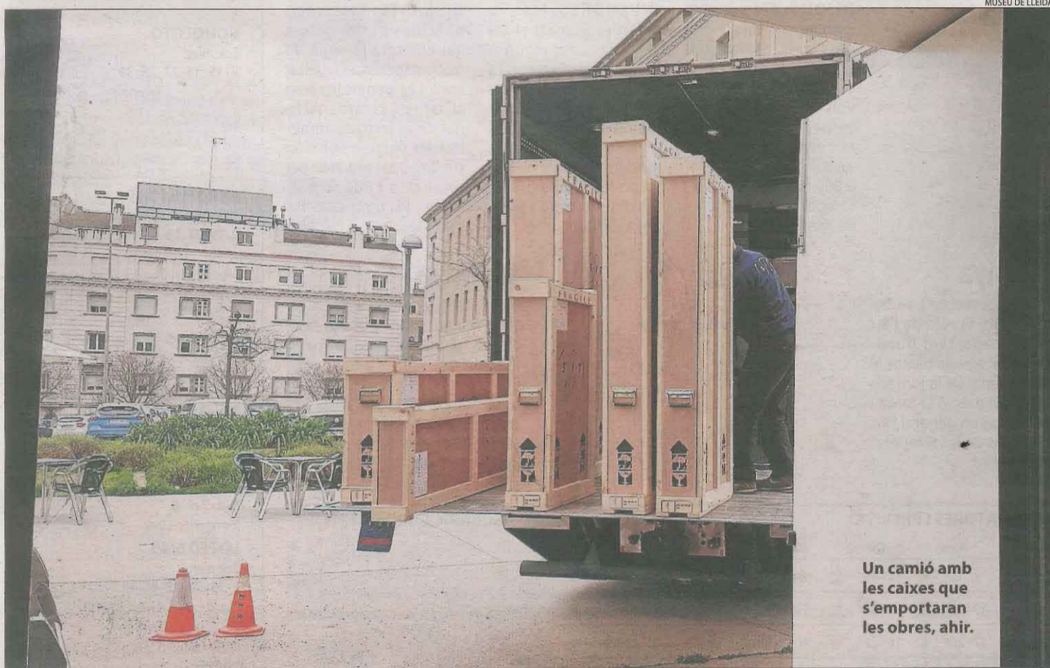
Un camió amb les caixes que s'emportaran les obres, ahir.