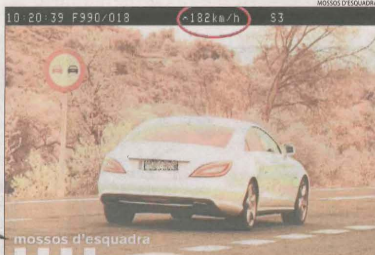
Moment en què els Mossos van captar el vehicle a l'N-240.

LES BORGES BLANQUES | Agents de l'Àrea Regional de Trànsit de Ponent de los Mossos d'Esquadra van denunciar penalment ahir un veí de Lleida de 24 anys com a presumpte autor d'un delicte contra la seguretat viària. Els fets van tenir lloc al matí, quan els agents havien establert un control de velocitat a l'altura del punt quilomètric 60 de la carretera N-240, dins del terme municipal de les Borges Blanques. En el transcurs del control van detectar un vehicle, amb matrícula espanyola, que circulava a 182 quilòmetres per hora en direcció a Tarragona, en un tram de la carretera on la velocitat màxima permesa és de 90 quilòmetres per hora. Una patrulla de Trànsit va poder parar el vehicle poc després. Els agents van identificar