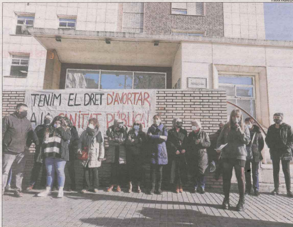
Protesta de col·lectius feministes davant de la delegació territorial de Salut a Lleida, al desembre.

ahir des d'Arran, que en un acte davant de la Fundació Sant Hospital de la Seu va lamentar que aquest centre no "porti el debat sobre la taula" del seu patronat, integrat entre altres pel bisbat d'Urgell. En aquest sentit, van assegurar que "l'objecció de consciència, el paper de l'església i la privatització dels serveis" són les principals traves que limiten l'exercici d'aquest dret. La formació, que ha posat en marxa la campanya Les joves decidim, avortarem! , va dir que han trobat casos en què "es dona una informació falsa sobre la píndola de l'endemà" i es diu a les menors que no la poden adquirir sense el permís dels pares.