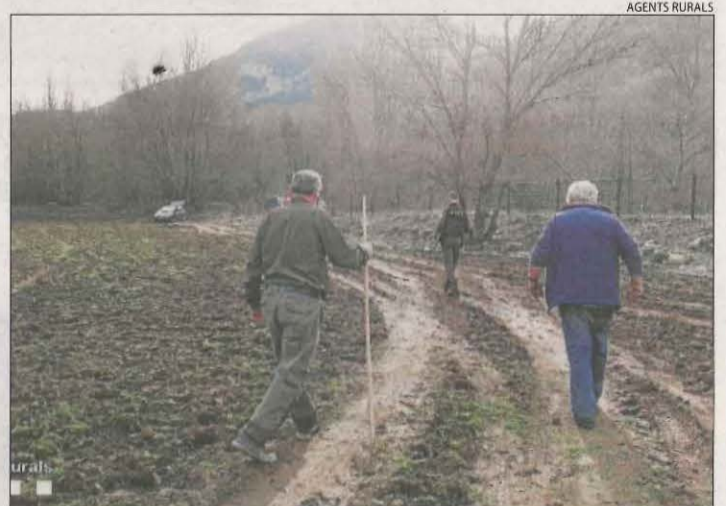
Els Agents Rurals han aixecat acta de l'incident.