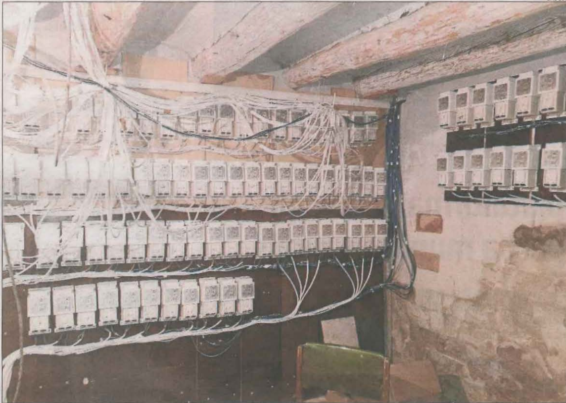
Imatge d'una connexió il·legal en una plantació de marihuana a Lleida.

Les connexions il·legals preocupen Endesa perquè perjudiquen la resta dels abonats. La xarxa se sobrecarrega i es desconnecta per autoprotegir-se. Aquesta interrupció danya la mateixa línia i provoca una desconnexió a tots els clients. Per aquesta raó, la companyia treballa de manera coordina-