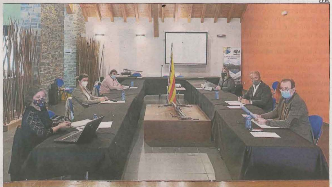
La reunió de dimarts a Sort dels presidents dels consells del Pirineu i la síndica d'Aran.

A la trobada, també es va debatre sobre els fons europeus per a la recuperació després de la pandèmia i la seua repercussió a les comarques de muntanya. Van assenyalar que es vol incidir en tots els projectes que suposin la reactivació i la diver-