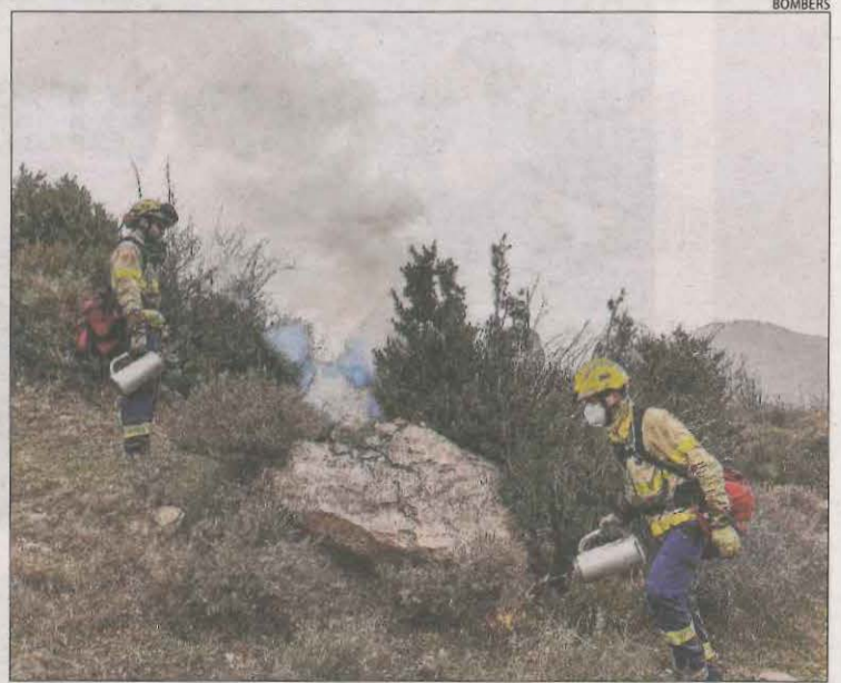
Bombers van fer ahir una crema a Sarroca de Bellera.

D'altra banda, els especialistes en incendis forestals dels Bombers, els GRAF, van fer ahir diverses cremes controlades. Una va tenir lloc a la zona de les Esglésies de Sarroca de Bellera, a la comarca del Pallars Jussà.