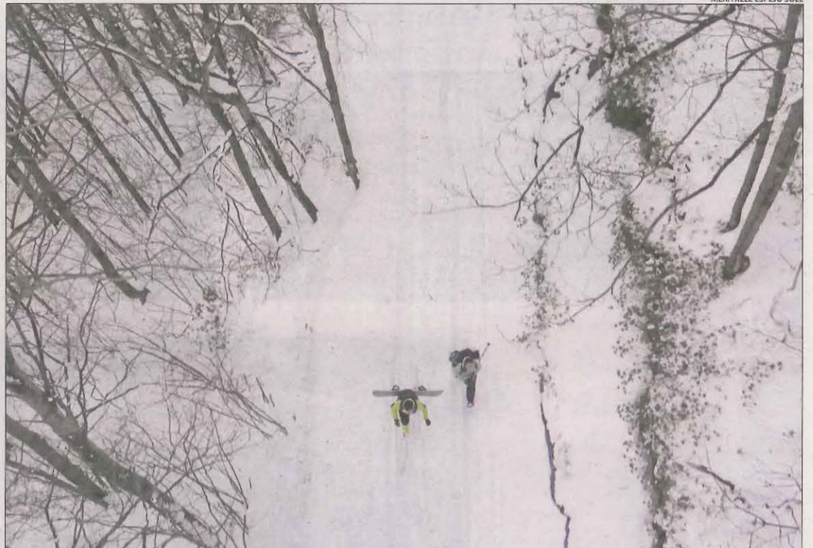
Dos esquiadors a vista de dron a la muntanya de Filià.