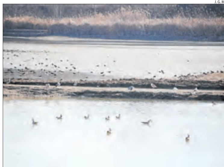
L'estany d'Ivars i Vila-sana, un dels atractius del Pla.

MONTGAI | Montgai ha finalitzat les obres de sanejament i consolidació del mur d'accés a la zona de les piscines del nucli de Butsènit. Aquests treballs eren necessaris per evitar que caiguessin pedres a la zona de l'antiga muralla. L'actuació ha permès recuperar elements arquitectònics. Els treballs han comptat amb una inversió de fins a 10.300 euros.