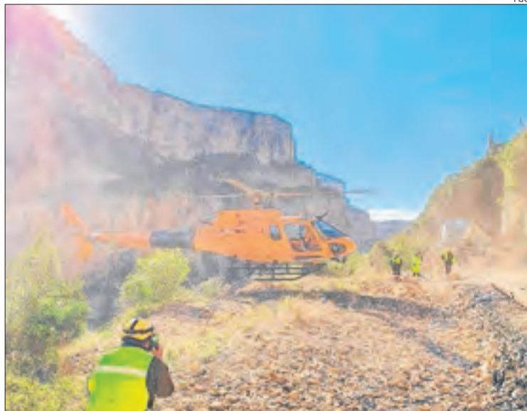
Un helicòpter va ajudar en els treballs. Al fons, el tren descarrilat.

Els treballs que es van portar a terme ahir, i que van arribar a la cota 20, van requerir un helicòpter i drons per poder avaluar els moviments de la muntanya. A la zona també es van desplaçar tècnics de l'Institut Cartogràfic per fer diferents mesuraments al talús, a la zona on hi havia xarxes anti-allaus instal·lades. Avui està previst