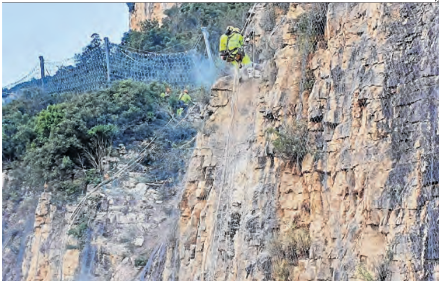
Els operaris fan mesuraments per comprovar els moviments de la muntanya on es va produir el despreniment.