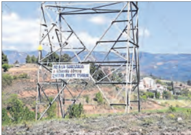
Pancarta en contra d'una subestació a Figuerola d'Orcau.

L'esborrany del pla estatal, actualment en informació pública, arxiva una altra polèmica línia vinculada al projecte de