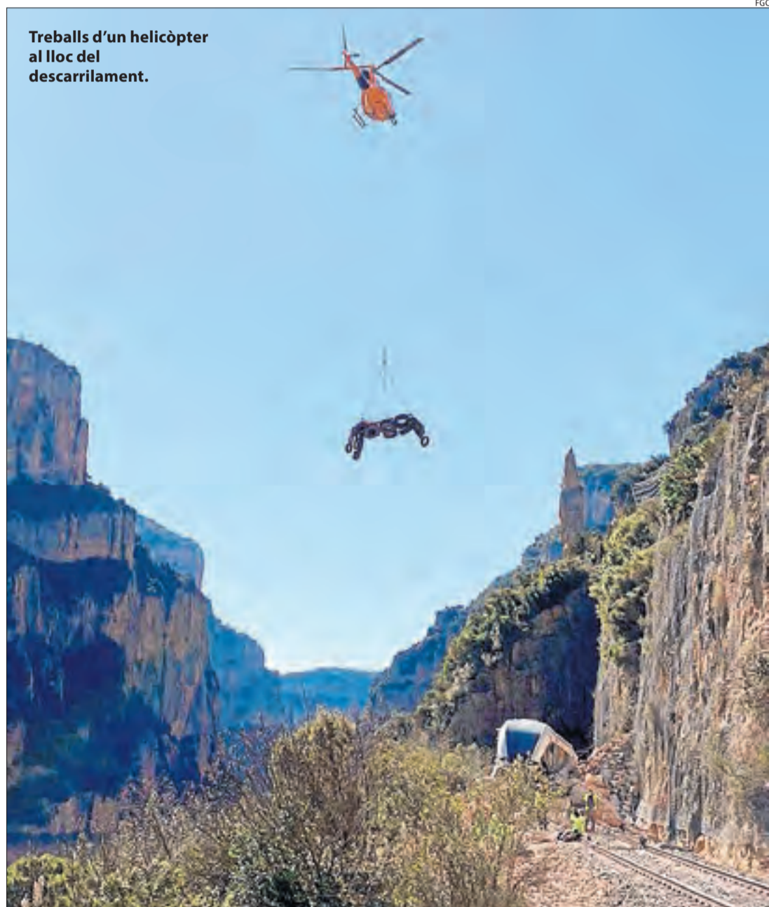
Treballs d'un helicòpter al lloc del descarrilament.