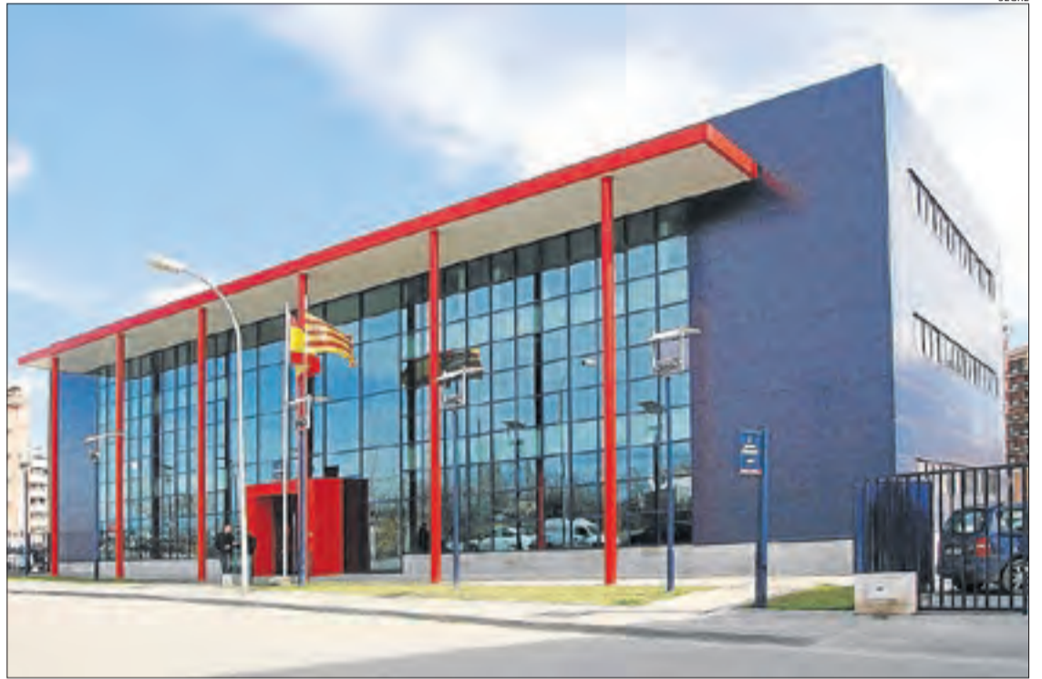
Vistes de la comissaria dels Mossos d'Esquadra, al carrer Sant Hilari de Lleida.

en immobles de tot Espanya, conclou que el confinament de primavera i les limitacions de mobilitat establertes per contenir la pandèmia han obligat els delinqüents a centrar l'atenció en els segons habitatges, on sostreuen un botí més elevat. I és que la indemnització mitjana pagada per una companyia d'assegurances a Espanya arran