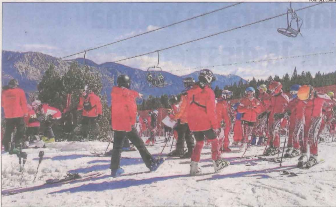
Alumnes de clubs d'esquí diumenge durant un entrenament a Port del Comte.