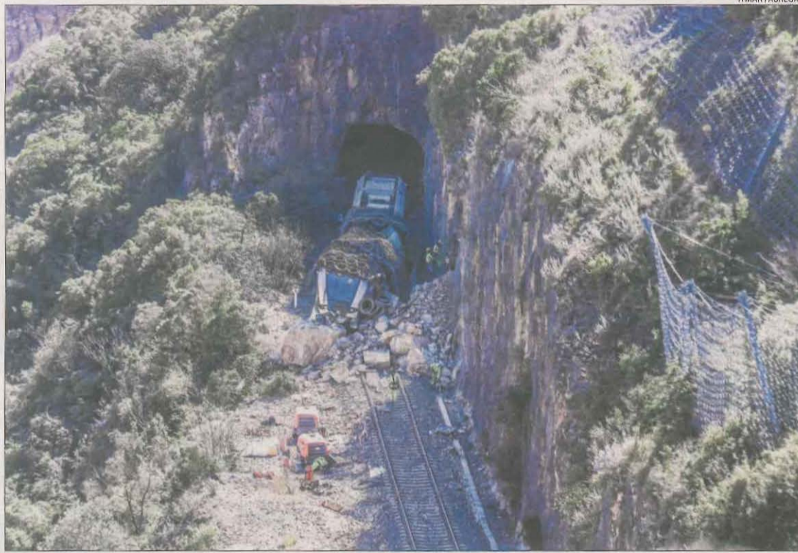
El tren protegit amb pneumàtics al lloc del sinistre, on s'està sanejant el talús.

Els treballs per estabilitzar les cotes baixes del talús es prolongaran fins avui. A partir de llavors començaran a treballar a les més altes, des d'on van caure les pedres. La previsió és donar