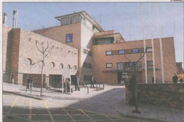
Imatge d'arxiu de l'Hospital del Pallars.

X.R. | TREMP/VIELHA | Tremp va tancar ahir equipaments durant 7 dies davant de l'augment de contagis i després que el risc de rebrot hagi arribat als 1.090 punts. Fonts municipals van explicar que actualment compten amb uns 24 casos actius. A l'Hospital del Pallars hi ha 10 persones ingressades per Covid i temen que l'augment de positius pugui provocar que el centre sanitari arribi al límit de la seua capacitat. A més, a l'escola Maria Immaculada hi ha 5 grups i 115 persones aïllades, segons les dades d'Educació. Per totes aquestes raons, i seguint les indicacions de Salut Pública, el consistori ha tancat els pavellons del Juncar i del Casal, l'edifici El Club, l'Espai Cultural La Lira i la biblioteca. A més, l'escola de música tornarà a oferir classes