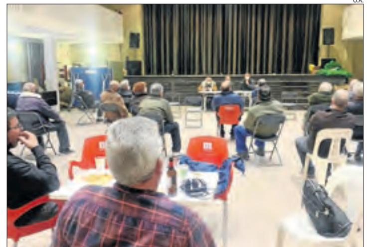
La reunió de pagesos afectats ahir a Bovera.

BOVERA | Pagesos disconformes amb els ajuts que Agricultura va presentar dijous per paliar els danys del temporal Filomena a les oliveres (vegeu SEGRE d'ahir) tornaran a tallar aquest diumenge la C-12 a Flix. La Taula Sectorial de l'Oli, integrada per UP, JARC, Federació de Cooperatives i DO Garrigues, va donar llum verda a aquesta proposta, que preveu el cobrament per mòduls segons afectació i sistema de cultiu per iniciar les negociacions de cara a perfilar una resolució final. Tanmateix, l'alcalde de Bovera, un dels municipis de les Garrigues on els perjudicats a les oliveres superen el 80%, exigeix que hi hagi una partida concreta per afrontar les pèrdues i que no s'exclouï els pagesos que no