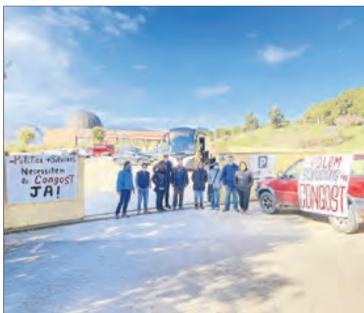
Empresaris van protestar ahir pel tancament del congost.

La Diputació atorga fons d'emergència perquè l'ajuntament d'Àger retiri les roques que van caure al novembre || Aborda amb la corporació provincial d'Osca el pla de gestió del congost