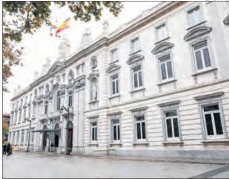
Imatge d'arxiu del Tribunal Suprem

El Suprem ha donat la raó al TSJA, ha desestimat el recurs i ha ratificat la condemna. Així, respecte a si s'havia d'apreciar com a temptativa, recorda que la llei determina que "quedarà consumat el delictes si l'acció de l'acusat origina un trasllat