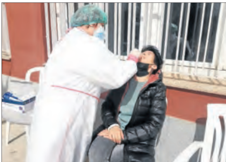
Una familiar se sotmet a una prova en una residència de la Seu.

de Malpartit (Torrefarrera) és roja , per un “brot en investigació”, segons Salut. Fonts de la conselleria van assenyalar que es tracta d'un nou ingrès procedent de l'hospital que tenia una PCR positiva, però sense “capacitat infecciosa”. Durant