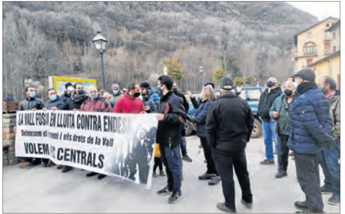
Les protestes han tornat a repetir-se pel conflicte dels rebuts de la llum.