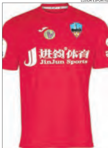
La samarreta de la campanya.