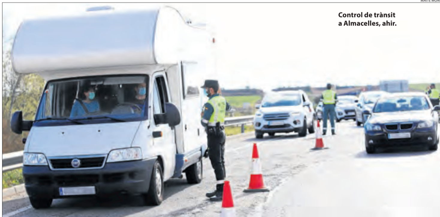
Control de trànsit a Almacelles, ahir.