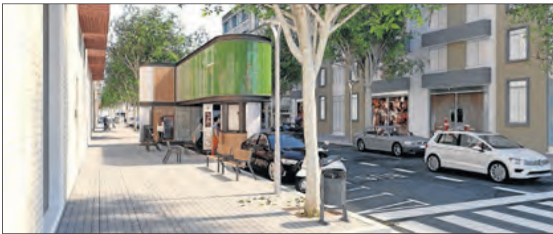
Render d'“upandbike”, imatge de Teectura.

Ignasi Clotet té més de 70 anys d'experiència en disseny, fabricació i muntatge d'instal·lacions industrials automatitzades i creiem que és aquest