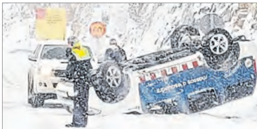
ÉS NOTÍCIA | 3-6

Cadenes a la Bonaigua, algunes sortides de via, com a la foto, i baixes temperatures, encara que per avui el temps millorarà