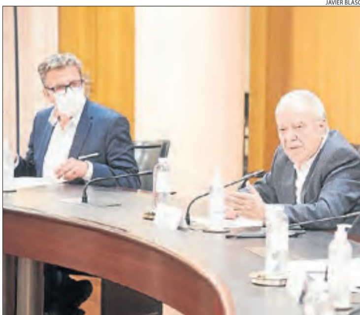
Constitució de la comissió de seguiment de Mont-rebei.