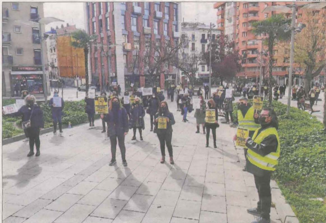
Alguns dels professionals del sector que es van concentrar ahir a la plaça Cervantes de Lleida.

pandèmia en aquestes petites empreses, amb unes pèrdues en la facturació que podrien superar el 30 per cent en comparació amb les dades del 2019. La d'ahir va ser la tercera protesta al davant de l'edifici de la delegació territorial d'Hisenda, en la qual els representants de les perruqueries i els centres d'estètica lleidatans van reivindicar que «som essencials i ens pertany l'IVA reduït que ens van