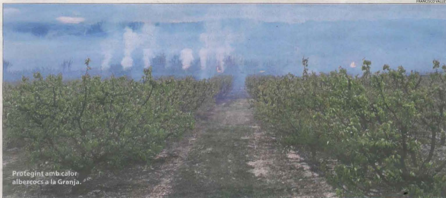
Protegint amb calor albercocs a la Granja.