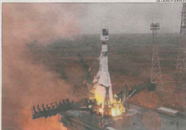
Llançament ahir del coet que transportava el nanosatèl·lit.