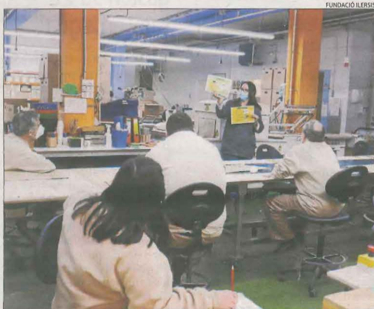
Membres de la fundació durant una classe del curs.

El Govern preveu injectar 18 milions d'euros en quatre anys en aquesta estratègia, que preveu la creació d'una agència espacial i la posada en òrbita dels dos primers nanosatèl·lits. L' Enxaneta és el primer, de la mà de l'empresa catalana Sateliot i la britànica Open Cosmos. El segon nanosatèl·lit es llançarà a finals d'aquest any o a començaments del vinent i oferirà serveis d'observació de la Terra, cosa que permetrà obtenir imatges des de l'espai en diferents bandes espectrals per a l'estudi del territori.