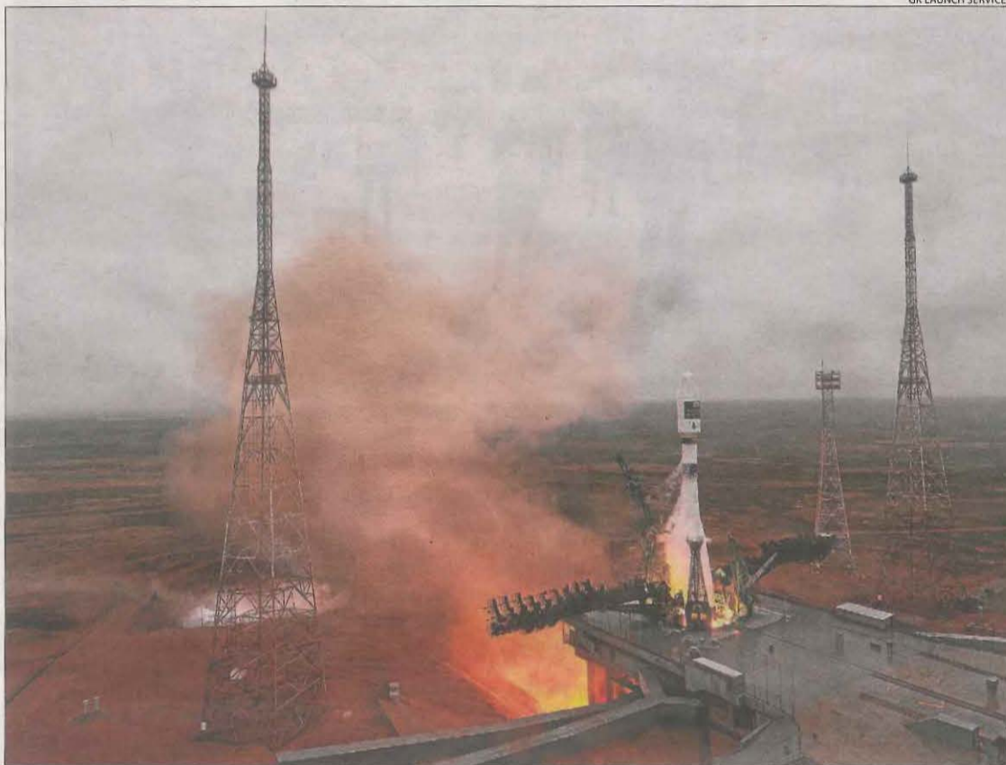
Vista del llançament ahir del coet que transportava el nanosatèl·lit 'Enxaneta' al Kazakhstan.

Les dades que reculli es transmetran a l'estació terrestre situada a l'Observatori del Montsec