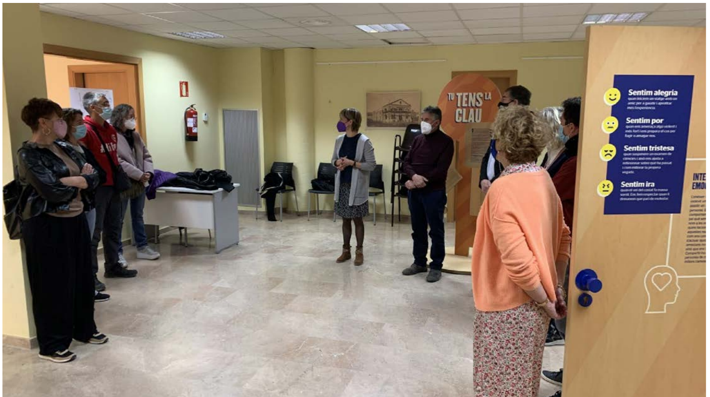
Un moment de la inauguració de l'exposició "Tu tens la clau", a Tremp G.L.T.

TREMP El Casal Cultural de Tremp ha acollit aquest dilluns la inauguració de l'exposició "Tu tens la clau", una mostra que durant el 2021 recorrerà quatre biblioteques de l'Alt Pirineu i Ponent. L'exposició, elaborada i impulsada per l'ONG per a les addiccions Projecte Home Catalunya i coorganitzada pel Departament de Cultura de la Generalitat de Catalunya - Central de Biblioteques de Lleida, té com a objectiu conscienciar els més joves i el conjunt de la població sobre els riscos de l'abús de drogues. La mostra compta també amb la col·laboració de la Paeria de Balaguer, l'Ajuntament de Tremp i la Diputació de Lleida. Es tracta de la tercera