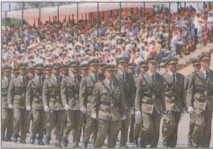
Imatge d'arxiu de sergents desfilant a l'Acadèmia de Talarn

Un portaveu del grup assegura que hi ha "referències explícites al franquisme a les unitats". "Una de les més palmàries és que al Terç Gran Capità de la Legió existeixi la I Bandera Comandant Franco". "No creiem que a Alemanya existeixi algun tipus d'unitat dedicada a Hitler, però és una mostra de l'anormalitat democràtica que existeix a Espan-