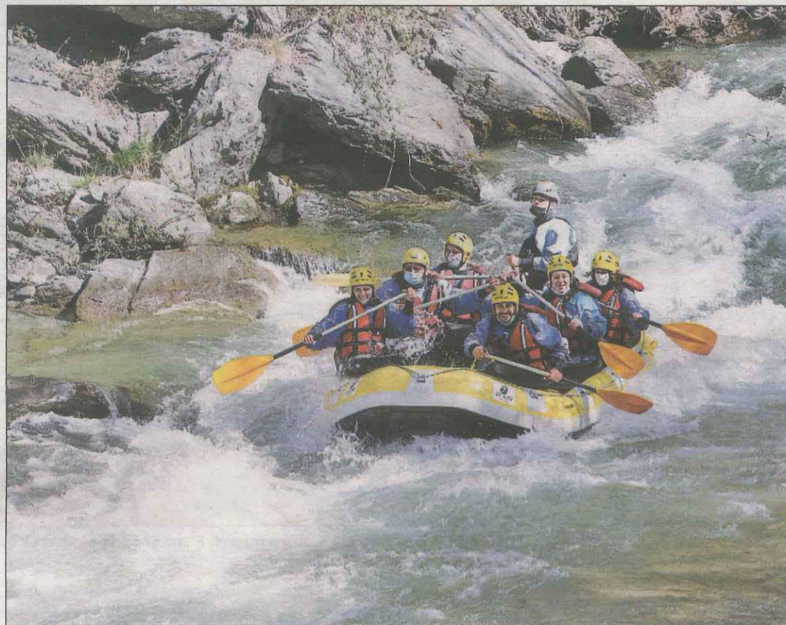
Una barca de ràfting baixant pel riu Noguera Pallaresa