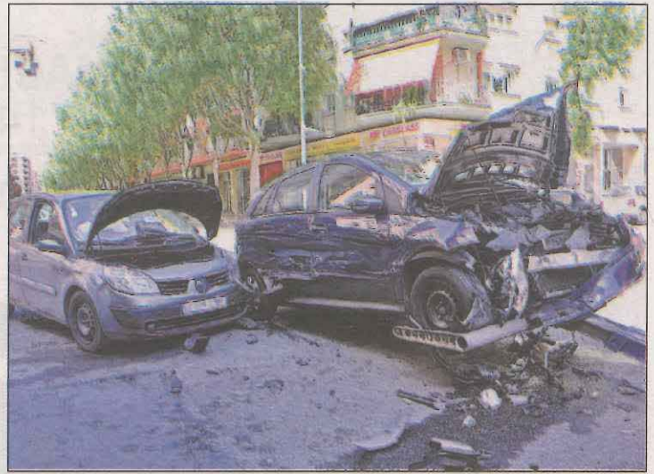
Estat en què van quedar els dos turismes

anys nombrosos casos d'apologia del feixisme a les Forces Armades espanyoles i denuncien que l'extremadreta està "normalitzada" als quaters davant la "total indiferència" del govern de Sánchez.