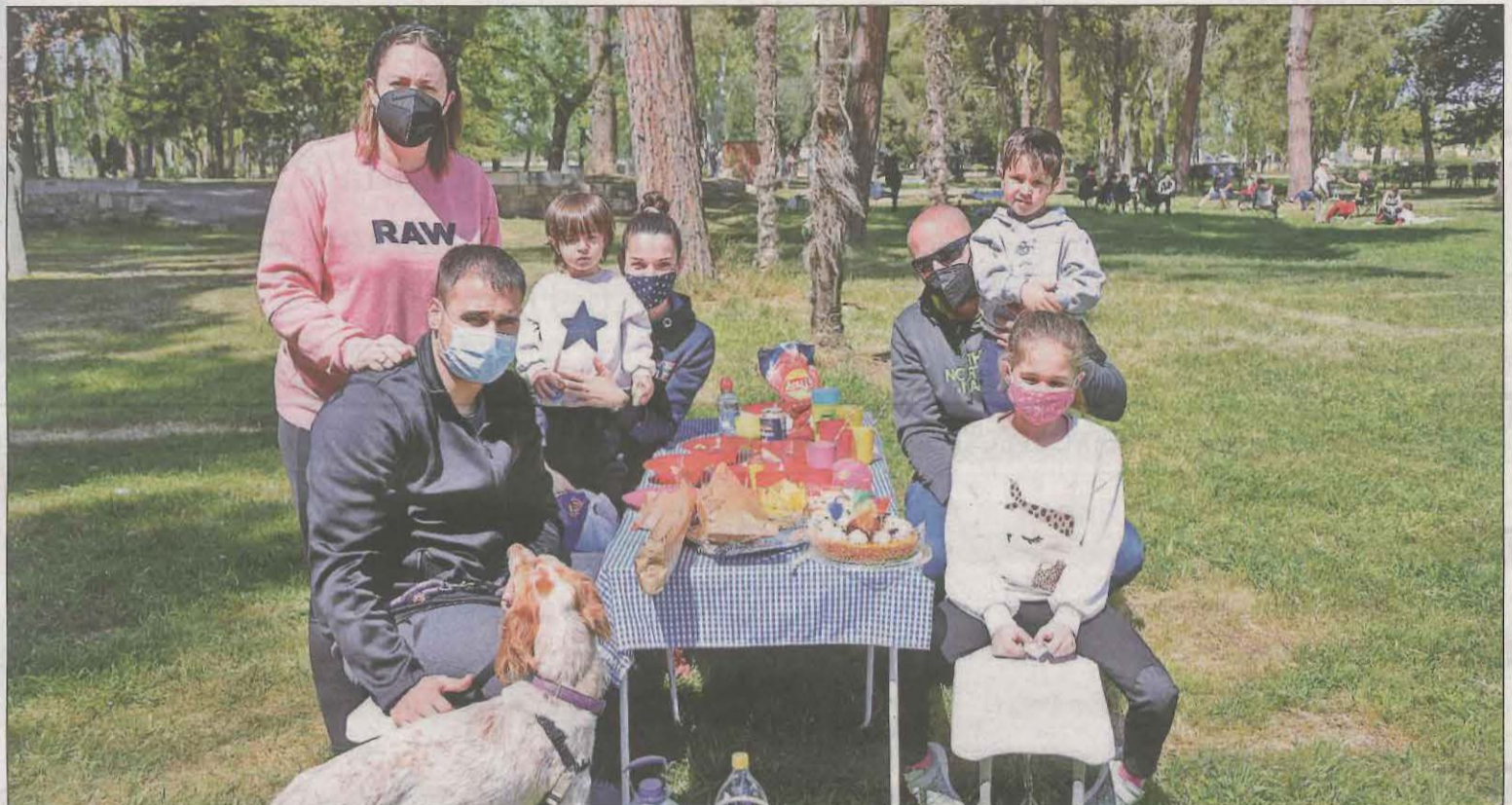
Una familia celebra la Mona en el recinto de les Basses