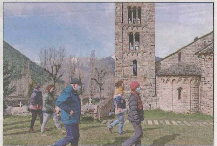
Més de 300 persones han fet les cinc rutes

A banda, algunes de les propostes del conjunt de la demarcació que han rebut un bon nombre de visitants han estat el Parc Nacional d'Aigüestortes i Estany de Sant Maurici, els diferents parcs naturals de la demarcació de Lleida, les esglésies de la Vall de Boí, el Centre d'Observació de l'Univers del Montsec o el monestir de Vallbona de les Monges.