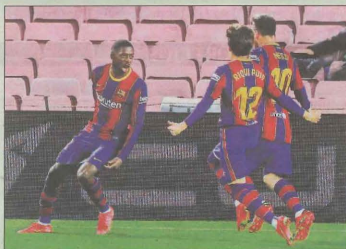
Ousmane Dembélé celebra el único gol del partido

Un gol de Ousmane Dembélé en el minuto 90 sirvió al Barça para conseguir la victoria ante un Valladolid que acabó con diez. El equipo de Ronald Koeman se coloca a un solo punto del Atlético de Madrid, que es el líder. DEPORTE | PÁG.25