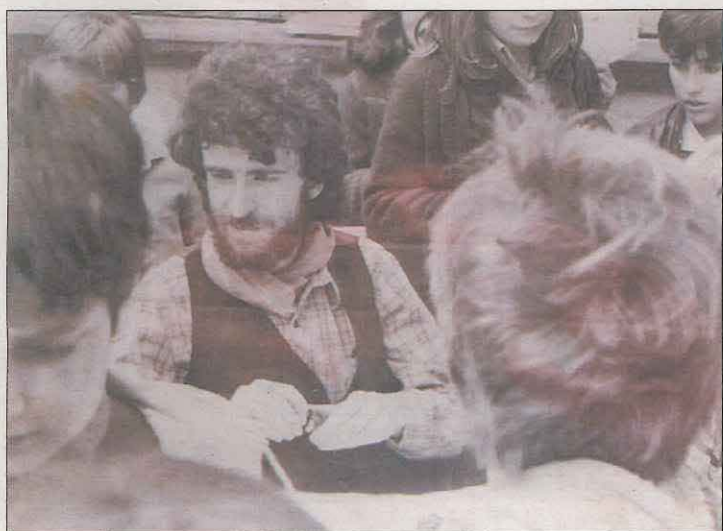
Les tres editorials han publicat llibres de Barceló

anticipada d'entrades (6 euros) es farà durant aquests dies a la copisteria Manhattan de Balaguer i el mateix dia abans de l'espectacle a la Paeria. A causa de les mesures sanitàries, l'aforament i les places seran limitades.