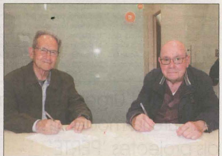
L'Associació ha cedit 1.730 fotografies