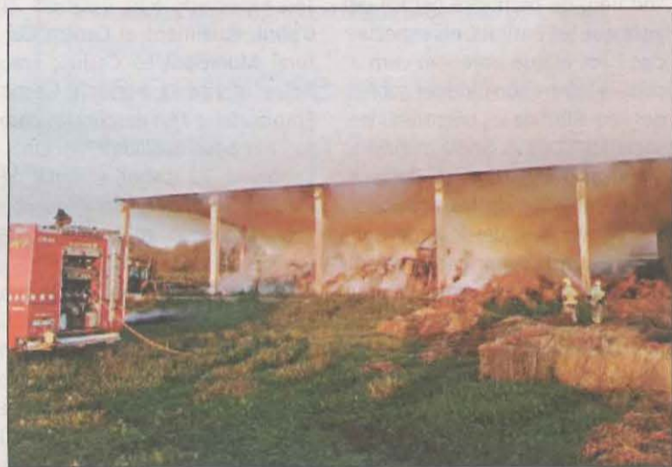
Moment en què els Bombers treballaven en l'extinció

Un incendi va calcinar la palla que hi havia acumulada en un cobert obert pels laterals situat en una granja d'Alguarrie, a l'altura del quilòmetre 15 de l'N-230. Emergències van ser alertada del foc a les 6.20 hores i van treballar un total d'onze dotacions dels Bombers així com maquinària agrícola fins a les 16.00 hores.