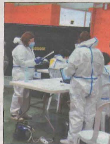
Les proves es faran dissabte al pavelló firal

Un 37% de les infermeres han tingut símptomes del Covid-19, segons una enquesta realitzada pel Sindicat d'Infermeria SATSE a un total d'11.645 professionals de l'estat espanyol. El sindicat subratlla que, en els darrers mesos, les infermeres han atès "de la millor manera possible els pacients i el conjunt de la ciutadania".