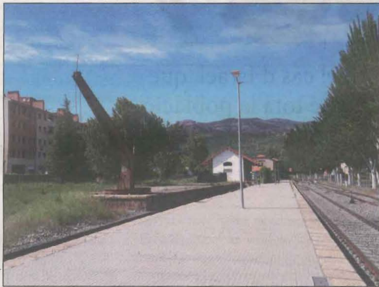
Pla general de l'estació de la Pobla de Segur

El mateix alcalde va indicar, però, que els responsables es van negar a facilitar el llistat de clients que van passar pel local i per aquest motiu, des de l'Ajuntament es va emetre ahir un ban demanant a tothom que hagi passat per l'establiment entre el