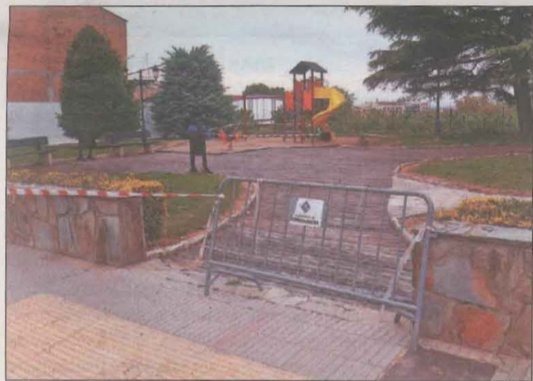
Imatge d'un parc del municipi precintat

L'alcalde també va explicar que des del CAP s'està fent molta feina per detectar casos i va augurar que les properes hores es detectin molts més casos. En cas contrari, l'edil va apuntar que es farà un cribatge a tota la població. "Abans, però, volem esperar a veure quina és la reacció a la publicació que hem fet, ja que de moment no sabem quin focus té i si afecta nens, joves o adults". En aquests moments, la Pobla té un risc de rebrot de 1.575 punts (el dia anterior era de 909,61) mentre que la velocitat de transmissió (Rt) és de 2,24. Des del consistori recorden la necessitat de complir les mesures de prevenció per evitar la propagació del Covid-19.