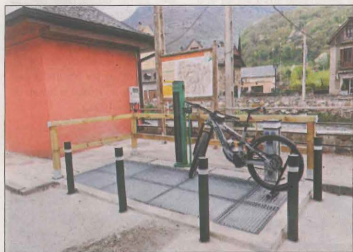
Està destinat a bicicletes elèctriques

La brigada municipal de Solsona ha començat els treballs previs a l'habilitació d'una nova rotonda a la carretera de Torà, a la cruïlla amb els carrers de Josep M. de Sagarra i Pompeu Fabra. L'objectiu de la mesura és endreçar el trànsit en una cruïlla molt ampla i fer minorar la velocitat dels vehicles en un dels principals eixos viaris de la ciutat.