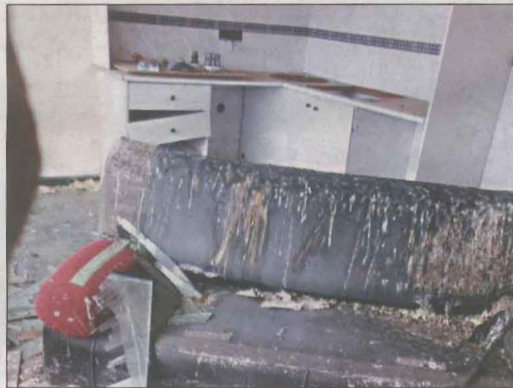
Un dels pisos abandonat i ple de brutícia