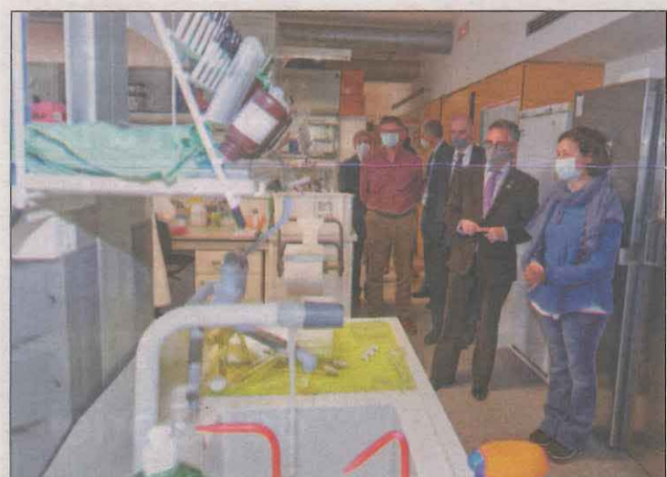
El conseller d'Empresa durant la seva visita a Lleida

El Consell Comarcal de les Garrigues ha posat en marxa el nou distintiu de qualitat 'Restaurant Verge Extra' al qual s'han adherit ja cinc restaurants de la comarca. La iniciativa té la finalitat de visualitzar aquells establiments de restauració de les Garrigues que apostin per l'oli d'oliva verge extra, pel producte local i tinguin un clar compromís amb el territori. La creació d'aquest distintiu forma part de les accions del projecte de la Cadena de valor de l'oli a les Garrigues de suport a la gastronomia del territori que està desenvolupant des del 2019 el consell comarcal per promoció i promoure la restauració, l'oli d'oliva verge extra i els productes agroalimentaris de la comarca. Per rebre el distintiu, els restaurants de la comarca han de complir amb una sèrie de requisits de reconeixement establerts per l'ens comarcal.