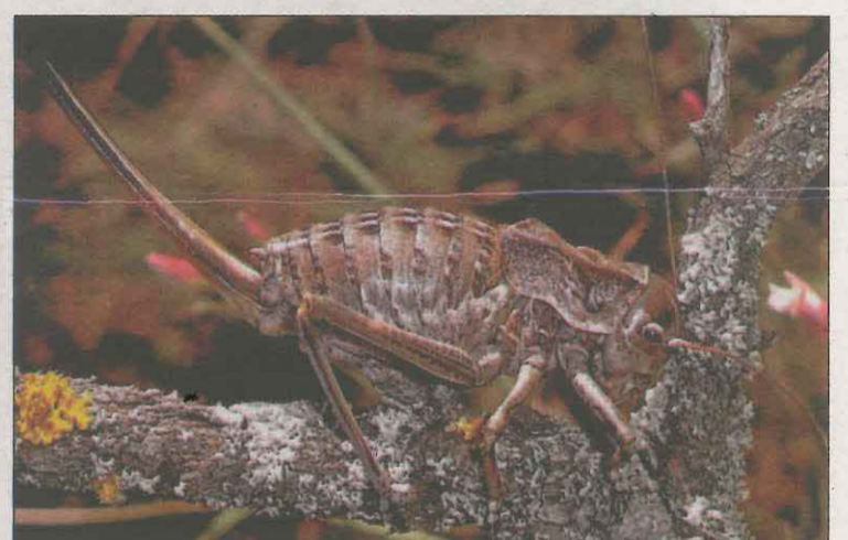
El seu nom comú és el de Somereta Davier

El Palau de Congressos de Tarragona va acollir la tercera de les quatre semifinals dels Premis Gastronòmics Josep Lladonosa, el 'màster xef' de les Escoles d'Hostaleria de Catalunya. Els joves xefs e competiran amb els millors estudiants de Catalunya a la gran final que se celebrarà al maig al Pavelló de l'Oli de les Borges Blanques.