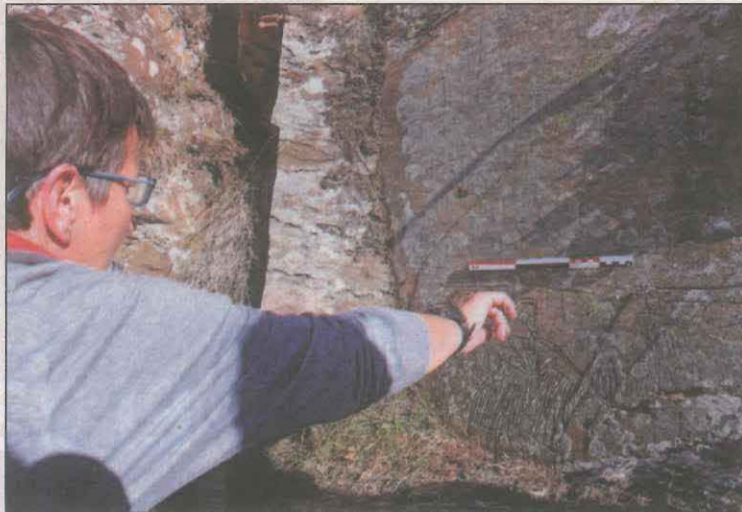
Una persona assenjala amb la mà un dels gravats