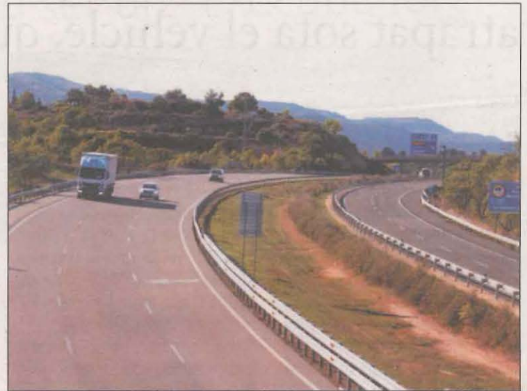
FOTO: ACN / Imatge de l'autopista AP-2 al seu pas pel municipi de l'Albi

Els cinc sectors afectats a Catalunya són el tram lleidatà de l'AP-2 limitrof amb Osca i la demarcació de Tarragona (incloses les àrees de servei de Lleida i Garrigues); els trams entre La Jonquera i Vidreres; el tram de l'AP-2 i l'AP-7 incloses les àrees de servei del Penedès, Medol, Alt Camp i Montblanc; i dos sectors més a la demarcació de Barcelona. Cal re-