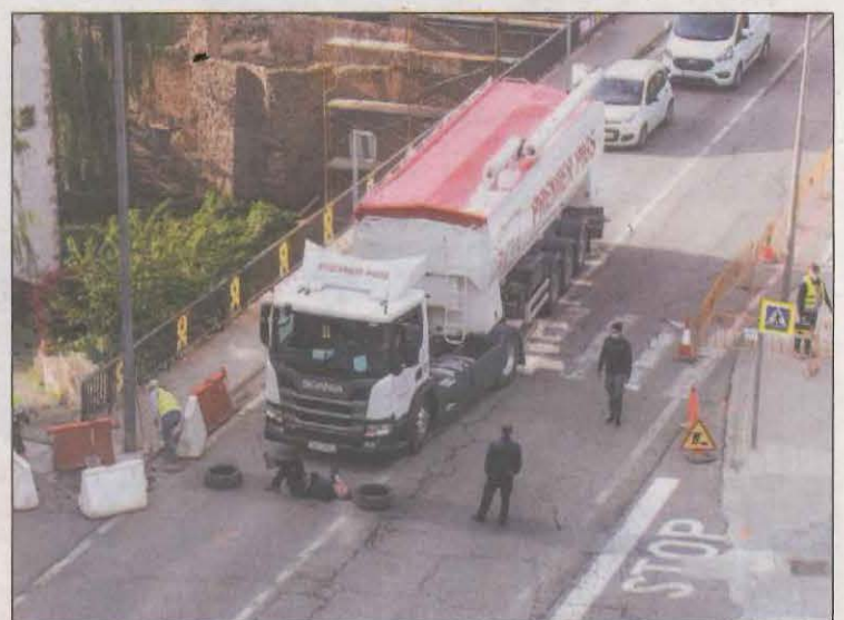
Un veí va tallar dijous el trànsit per protestar-hi

Els anys 2013 i 2017 es va revisar aquest Pla i continuava preveient aquesta rotonda i donat que es tracta d'una via principal en el seu pas per la població, l'obra és responsabilitat del departament de Territori i Sostenibilitat de la Generalitat de Catalunya. La Generalitat va redactar el projecte i