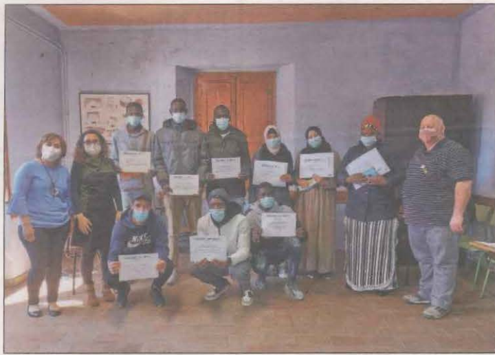
S'ha fet a l'escola de música municipal