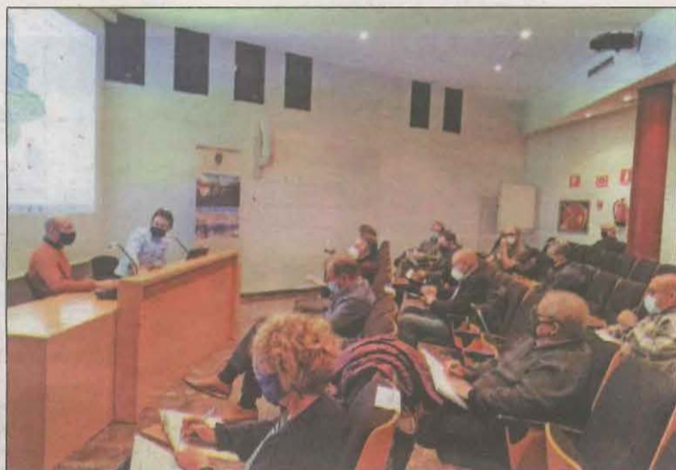
Es preveu tenir enllestit l'estudi al mes de juliol

Així, la proposta, que els ajuntaments que la comparteixin hauran d'incloure en el seu Pla d'Ordenament Urbanístic, tindrà en compte la normativa vigent i inclourà aspectes com els tipus de sòls, les pendents, la incidència solar, la