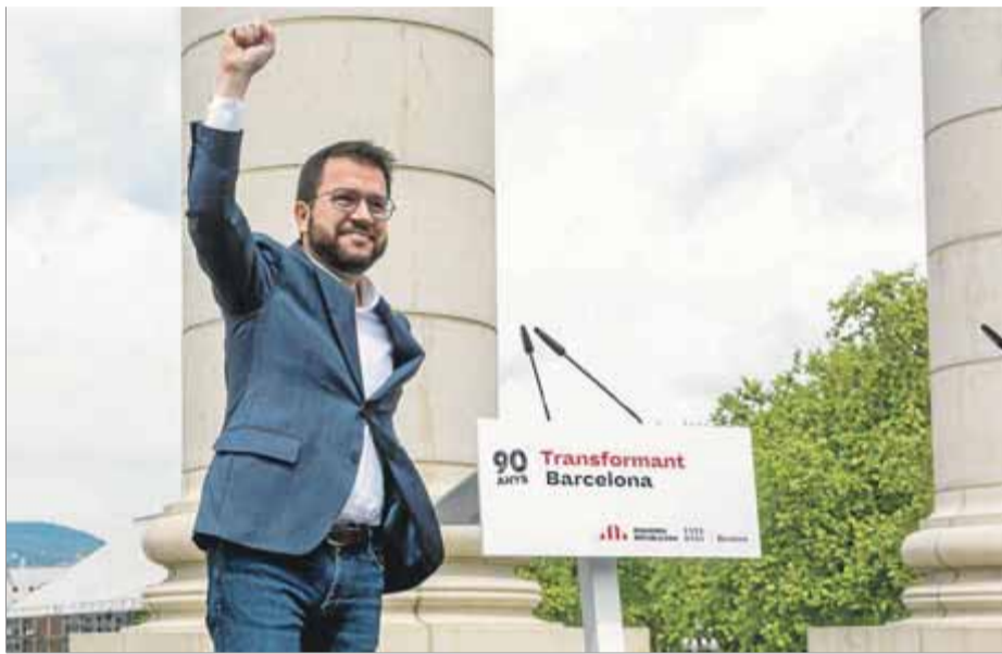
Pere Aragonès, alçant el puny ahir a Montjuïc, en l'acte de commemoració de la proclamació de la República que ERC va celebrar sota les columnes de Puig i Cadafalch

Com ja va fer dissabte de la setmana passada, Aragonès va tornar a urgir la formació de Puigdemont a arribar a un acord perquè, segons va dir, “hi ha molta feina a fer i l’hem de fer ja; no podem continuar xutant la pilota cap endavant”.