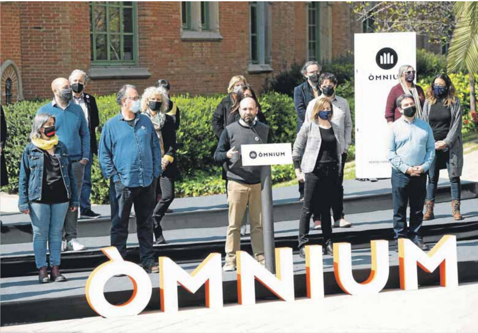
Els membres de la junta nacional d'Òmnium, ahir, al recinte modernista de l'hospital de Sant Pau, on es va llegir la declaració ■ JOSEP LOSADA