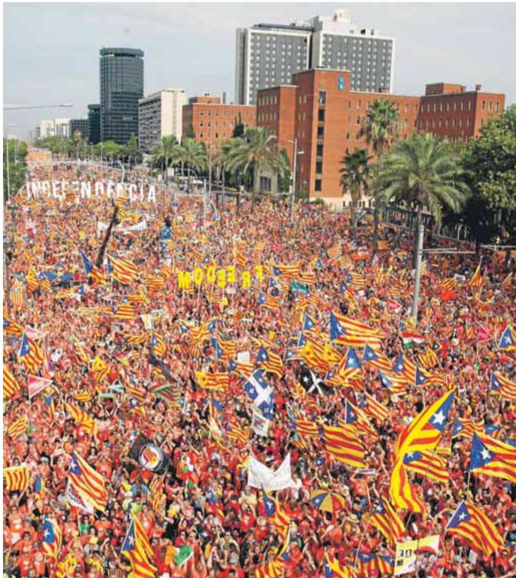
Acte central de la Diada del 2018 amb milers d'estelades i una bandera quebequesa

La principal novetat dels sis articles que dona per bons la sentència, que en ratifica una del 2018 del Tribunal Superior del Quebec, és que avala la constitucionalitat del que la llei qualifica com a “dret inalienable a escollir lliurement” el règim polític i l'estatus jurídic del poble quebequès, a més de la “regla del 50%+1”: en un hipotètic nou referèndum,