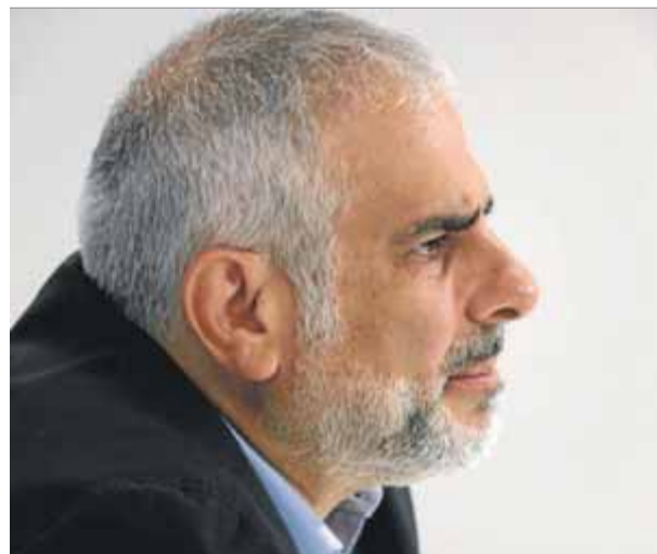
Carlos Carrizosa, el líder de Ciutadans al Parlament de Catalunya, en l'entrevista amb l'agència ACN

mació d'ultradreta Vox, i, posant al mateix sac el feixisme d'Abascal i els partits sobiranistes, a través d'un circumloqui no absent d'una certa deformació de la realitat, assegura que combatrà per igual "els discursos que assenyalin els andalusos i els que assenyalin els musulmans". ■