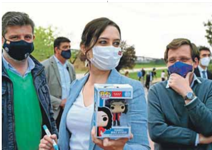
Ayuso firma en campanya la seva nina Funko Pop!

El tret de sortida formal de la campanya madrilenya del 4 de maig, que tot ho atura –inclosa la tramitació dels indults als presos polítics–, va arribar la mitjanit de dissabte –és l’efecte de vo-