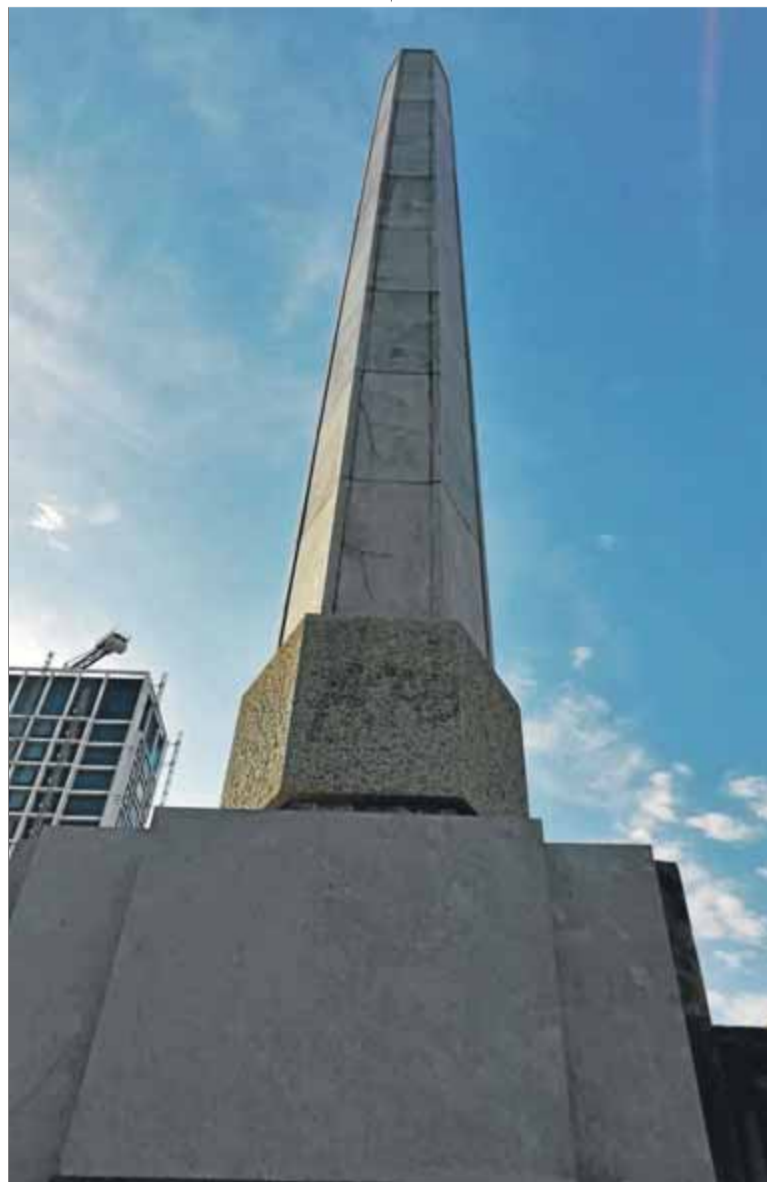
El monument, al passeig de Gràcia amb Diagonal (Barcelona), ara nu

El monument erigit en memòria del gran apòstol del federalisme republicà va ser convertit -avui en di-