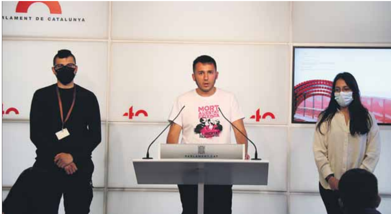
Membres de la plataforma en suport de Pablo Hasél compareixien ahir a la sala de premsa del Parlament

La plataforma en suport de Pablo Hasél ha convocat per al 15 de maig una manifestació unitària al davant del rectorat de la Universitat de Lleida per exigir la posada en llibertat del raper empresonat per enaltiment del terrorisme i injúries a la corona. Després de reunir-se al Parlament amb diputats d'ERC, Junts per Catalunya, la CUP i En Comú Podem, membres de la plataforma de suport a l'activista van compareixer a la sala de premsa de la cambra per anunciar la represa de les protestes amb una manifestació a la qual criden a participar-hi tota la ciutadania. La protesta, que volen que sigui unitària i transversal, tindrà lloc el 15 de maig a les cinc de la tarda davant de l'edifici del rectorat de la Universitat de Lleida, on Hasél s'havia tancat amb un grup de suport en contra