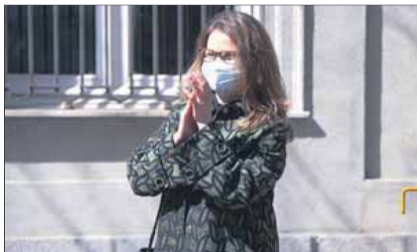
Serret es va presentar l'11 de març passat davant del Tribunal Suprem per regularitzar la seva situació processal

El jutge instructor del procés contra el referèndum de l'1-O, Pablo Llarena, ha cridat a declarar el dia 30 d'abril l'exconsellera d'Agricultura del govern de Puigdemont i ara diputada d'ERC, Meritxell Serret. La citació es fa després que s'hagués de suspendre una compareixença el 8 d'abril perquè la diputada estava en quarantena per la Covid-19