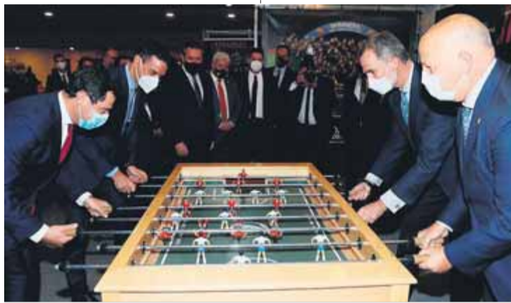
Sánchez i Felip VI jugant al futbolí abans de la final de la copa del Rei

"Secessionista" és la paraula inclosa en el comunicat de la Lliga de Futbol Professional (LFP) que presideix Tebas, que va ser cap de les joventuts de Fuerza Nueva a Osca i que ara és votant de Vox. "LaLiga condemna enèrgicament la proposta anunciada de creació d'una competició europea secessionista i elitista", deia el comunicat tot assumint la terminologia de "condemna" que sempre ha acompanyat els atemptats. Dues hores després, el govern de Pedro Sánchez atacava la Superlliga amb una plantilla de llenguatge proccessista pròpia de qui combat una iniciativa unilateral en un conflicte polític. "El govern d'Espanya, a través del seu ministre de Cultura i Esports, ha defensat davant dels seus interlocutors que s'ha de retornar al camí del diàleg i de l'acord en els àmbits de decisió i organització als