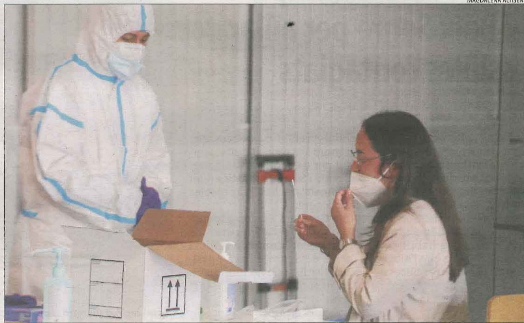
Una universitària es fa una PCR d'automostra en el cribatge de la setmana passada.

No obstant, al detectar que en algun cas la comunicació es podia haver retardat, la UdL va informar de manera interna la comunitat universitària del resultat de les proves de Cappont. Les dos persones po-