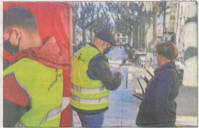
La consulta es va iniciar ahir i es va fer a peu de carrer.