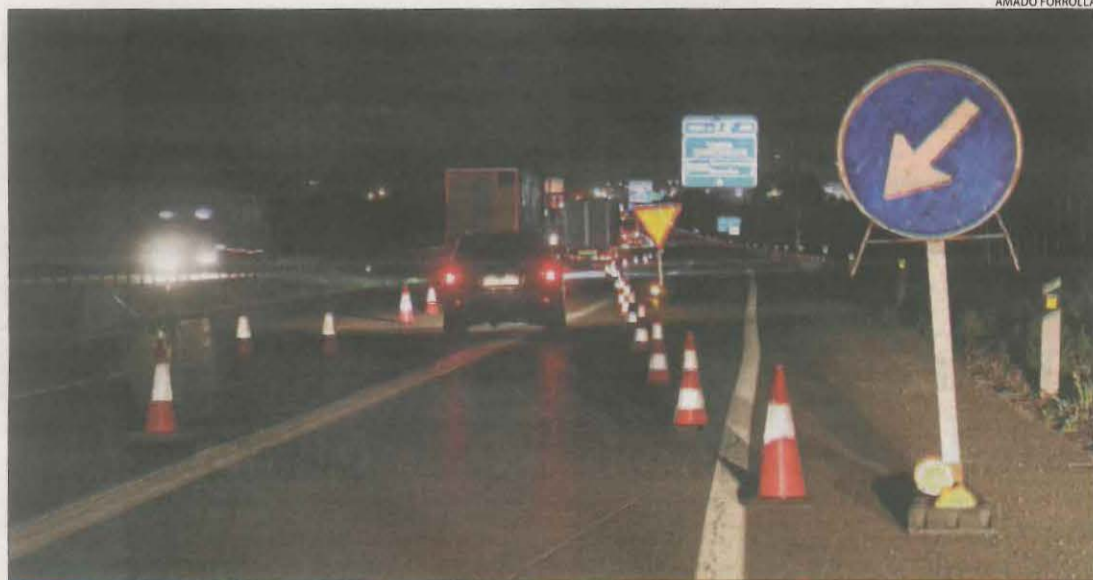
Senyals i cons desvien el trànsit al punt on s'inicien els treballs.