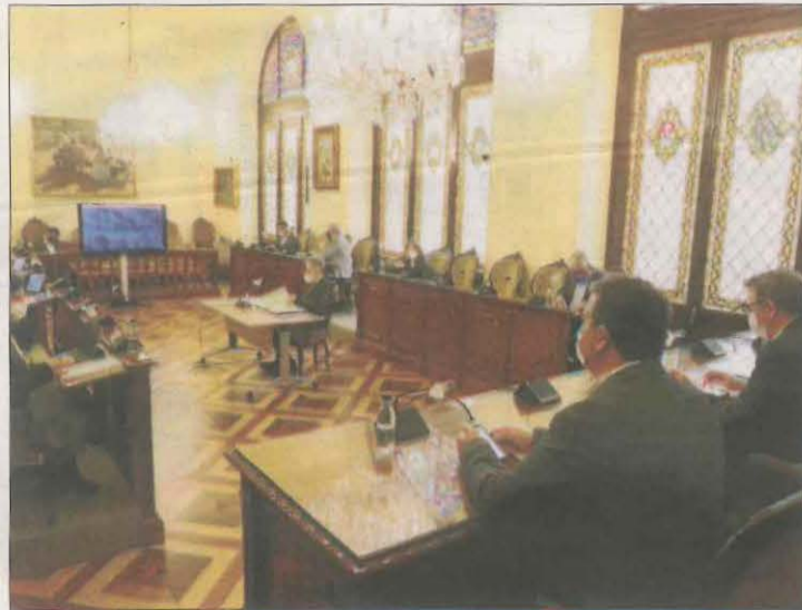
Imatge del passat ple de la corporació.