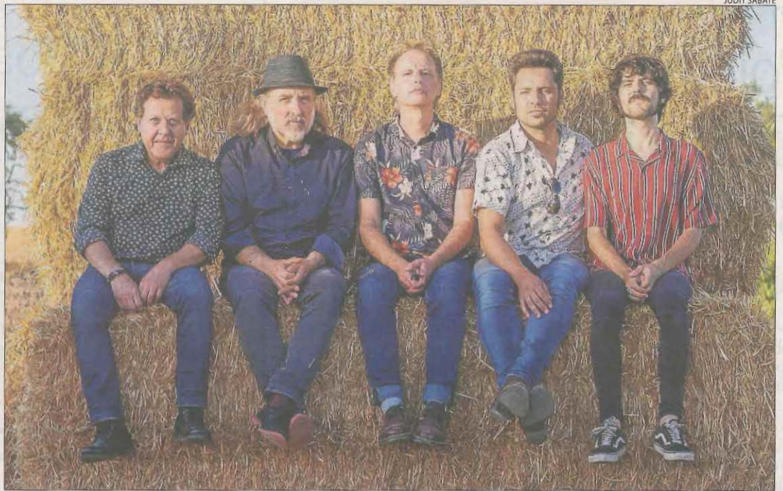
El grup Els Pets repassarà els èxits de la seua carrera musical amb un concert a Talarn el 10 de juliol.