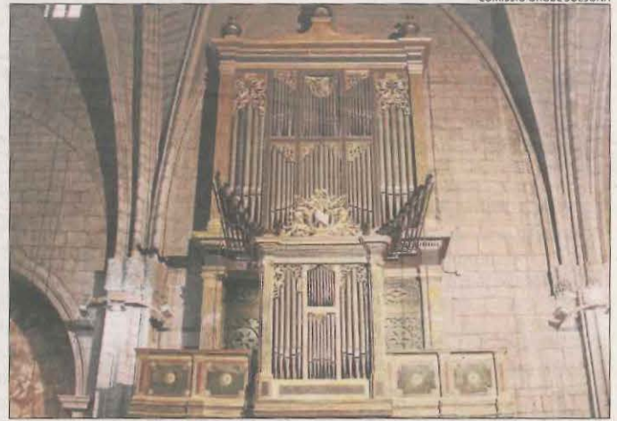
L'orgue de la catedral de Solsona, en fase de restauració.