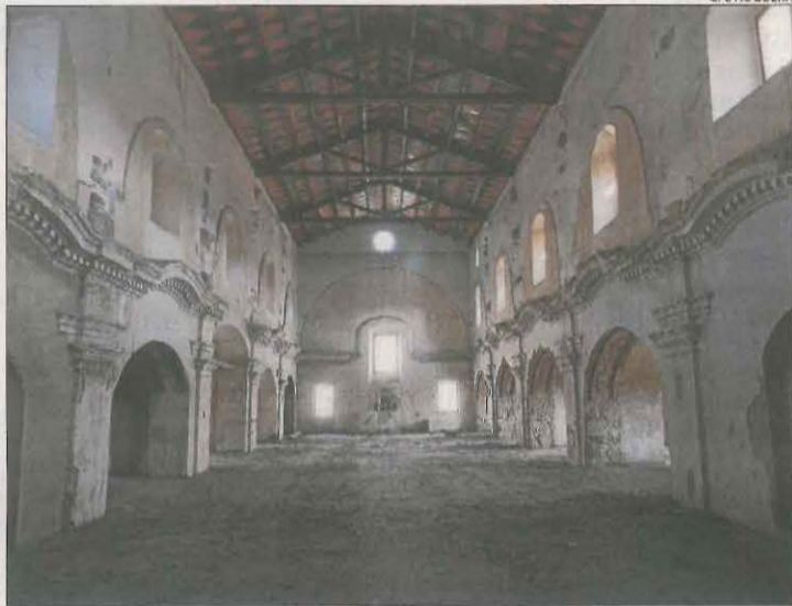
L'interior de l'antiga església de Sant Francesc a Balaguer.

El partit polític de Junts demana ara una restauració de l'edifici que permeti conservar-lo adequadament i recuperar-lo per a usos culturals i obert a la ciutadania, i que l'actual sala d'actes aculli les oficines tècniques de l'ens. Una proposta que no compta amb la