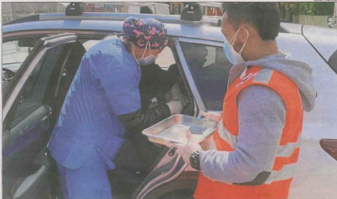
Vacunació d'una persona a l'interior d'un cotxe la setmana passada a la Seu d'Urgell.