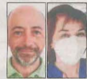
E. Sanjurjo/C. Aguar

El pilot de Cervera no va guanyar, però va demostrar la seua fusta de campió al quedar setè en la primera cursa després de nou mesos lesionat.