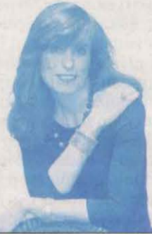
Mercè Rodoreda va morir en plena primavera. Demà farà justament trenta-vuit anys i una setmana

D urant el mes d'abril les flors sembla que ja volen despertar del llarg somni de l'hivern. Les plantes deixen anar les seves tiges mandroses, mig adormides i les flors que neixen quan el sol ens comença a escalfar la pell tiben amunt, festejant el jardí, impacients per mostrar els seus colors davant del món. Mercè Rodoreda va morir en plena primavera. Demà farà justament trenta-vuit anys i una setmana que l'escriptora es lliurava a la mort sense haver pogut veure despuntar les flors fantàstiques dels seu jardí imaginari. Aquella va ser la darrera primavera de la Rodoreda. Una primavera tenyida de negre que ella mateixa havia descrit literàriament a La mort i la primavera , una obra que va anar fent i refent, tossudament, al llarg de la seva vida literària però que mai no va arribar a lliurar al seu editor, Joan Sales, tot i que ella mateixa reconeix que serà la seva gran obra. En una carta a Sales de l'any 1961 així li ho diu: " La mort i la primavera és molt bo. Terriblement poètic i terriblement negre. Amb el meu estil d'ara, primera persona i procurant dir les coses de la manera més pura i inesperada. Serà una novel·la d'amor i de soledat infinita.