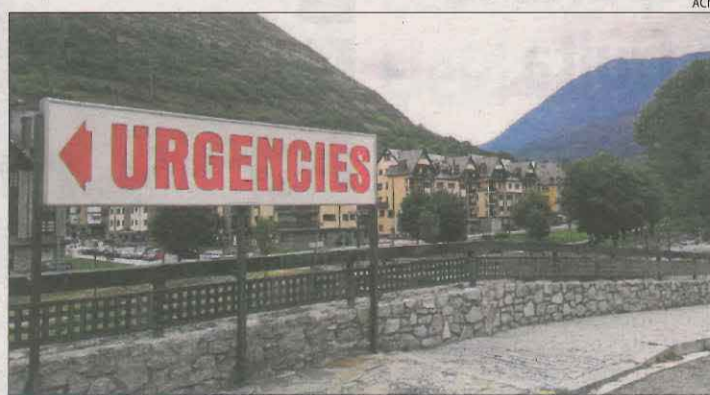
Imatge d'arxiu de l'Espitau de Vielha.

Quant al risc de rebrot, el Pallars Sobirà, la Val d'Aran i el Pla d'Urgell són els territoris catalans amb més taxes, amb 2.467, 1.149 i 959 punts,