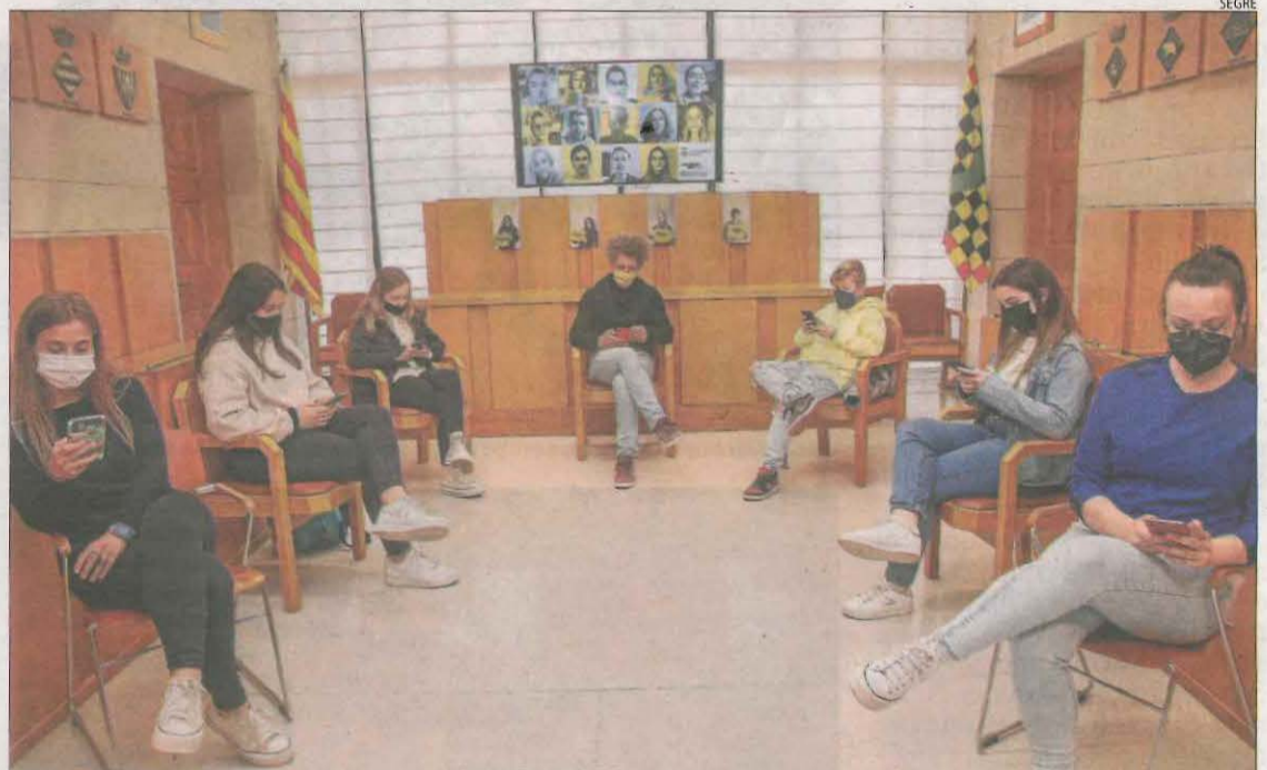
Impulsors i joves participants en l'acció del consell comarcal sobre l'addicció a les tecnologies.

El Projecte Home atén 45 persones amb problemes de drogues als centres de Balaguer i Tremp