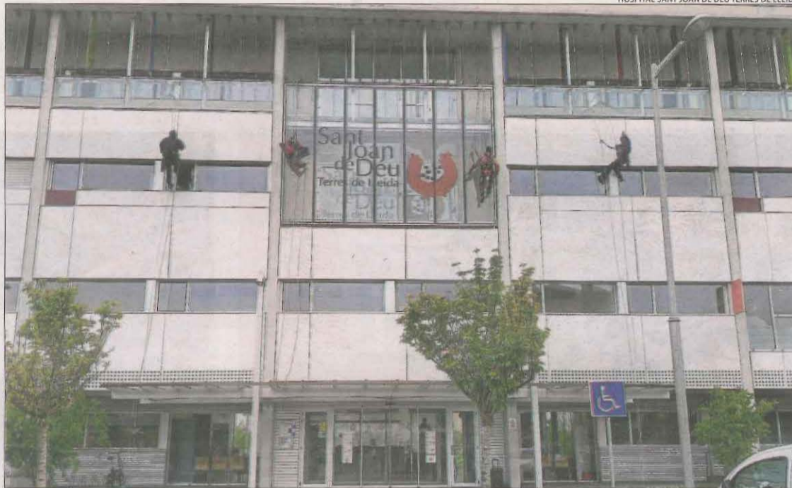
Quatre empleats d'Accés Vertical, disfressats de superherois, ahir al Sant Joan de Déu.

Davant d'aquesta situació, estan creant protocols d'actuació en coordinació amb els CAP