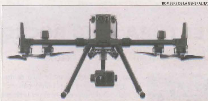
Imatge del dron, un DJI Matrice 300 RTK.

| BARCELONA | La tecnologia s'obre pas entre els Bombers de la Generalitat, que recentment han incorporat el primer dron que tindrà com a objectiu facilitar la tasca del cos. Seran els efectius de la Unitat de Mitjans Aeris els que en els propers mesos utilitzin aquest