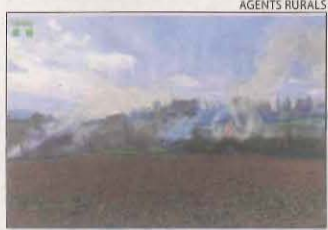
Crema a Gavet de la Conca.

AGENTS RURALS | GAVET DE LA CONCA | Els Agents Rurals van denunciar ahir el responsable d'una crema de marges sense autorització al terme municipal de Gavet de la Conca, a la comarca del Pallars Jussà, en una època en què aquestes pràctiques no estan permeses ni es poden autoritzar per risc d'incendi.