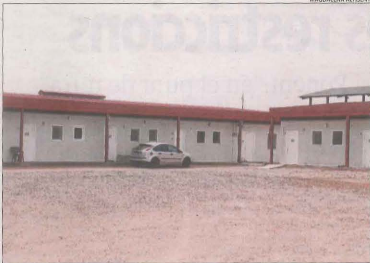
Alberg preparat per rebre els temporers a Alcarràs.