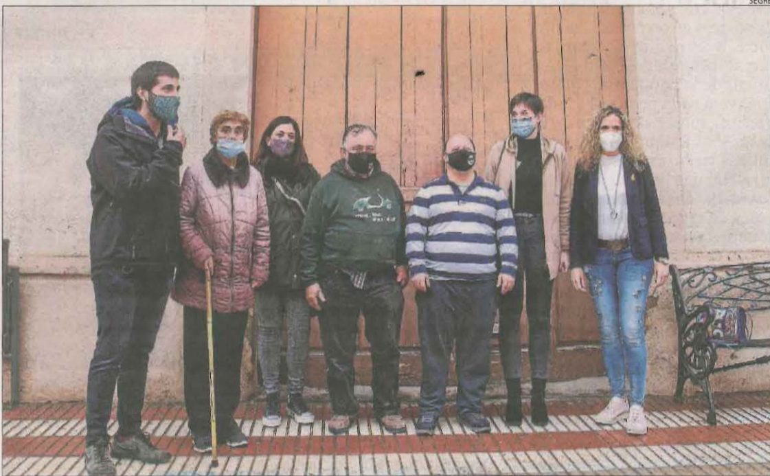
La presentació dels camps de treball per a aquest estiu va tenir lloc a Isona i a Agramunt.

Així doncs, cinc camps són nous per la temàtica o pel municipi que els acull. Es tracta de la Sentiu de Sió (neteja de trinxeres i refugis de la Guerra Civil), l'estany d'Ivars i Vila-sa-