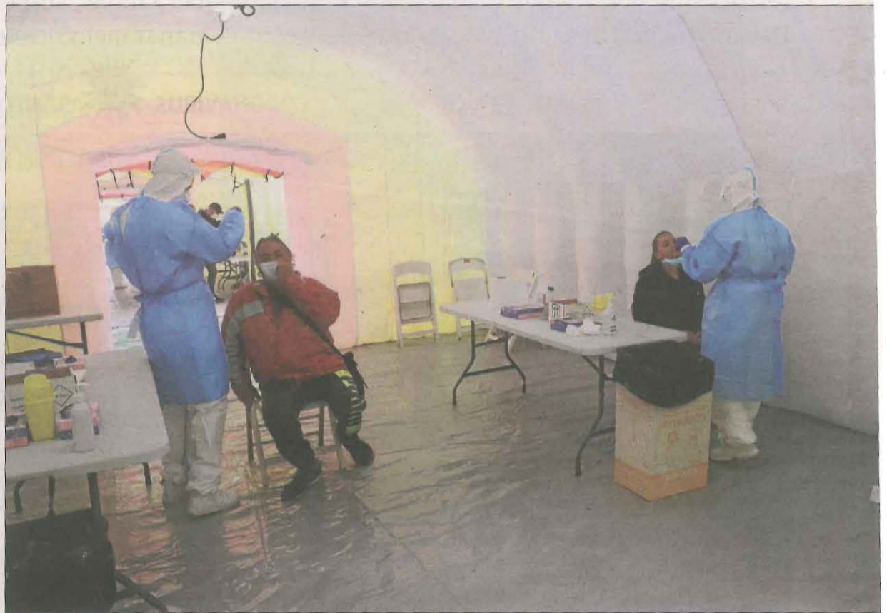
Dos veïns de la Mariola, en el cribratge amb proves PCR realitzat ahir.