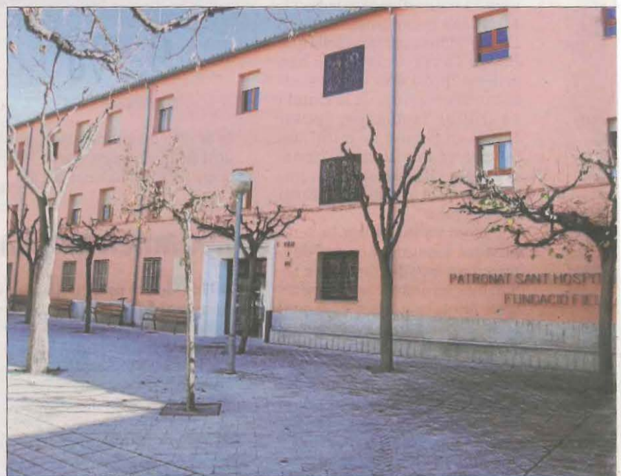
Imatge d'arxiu de la residència de Tremp, on hi va haver 61 morts per coronavirus.

Per la seua part, un total de 324 localitats no han registrat fins ara ni un sol mort per Covid. Aquest és el cas de Rosselló, el Palau d'Anglesola, Naut Aran, Artesa de Lleida i Corbins.