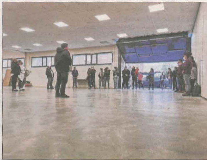
La reunió del passat dia 7 entre l'ajuntament i les famílies.

Per la seua part, fonts de les famílies van assenyalar que estan "contents que hagin parat el concurs i que ens hagin escoltat" i van apuntar que es-