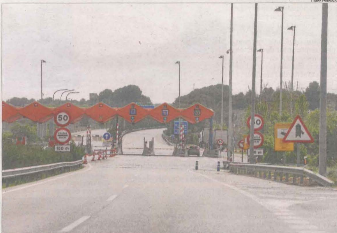
El peatge de l'AP-2 a Lleida. L'autopista creua setze municipis del Segrià i les Garrigues.