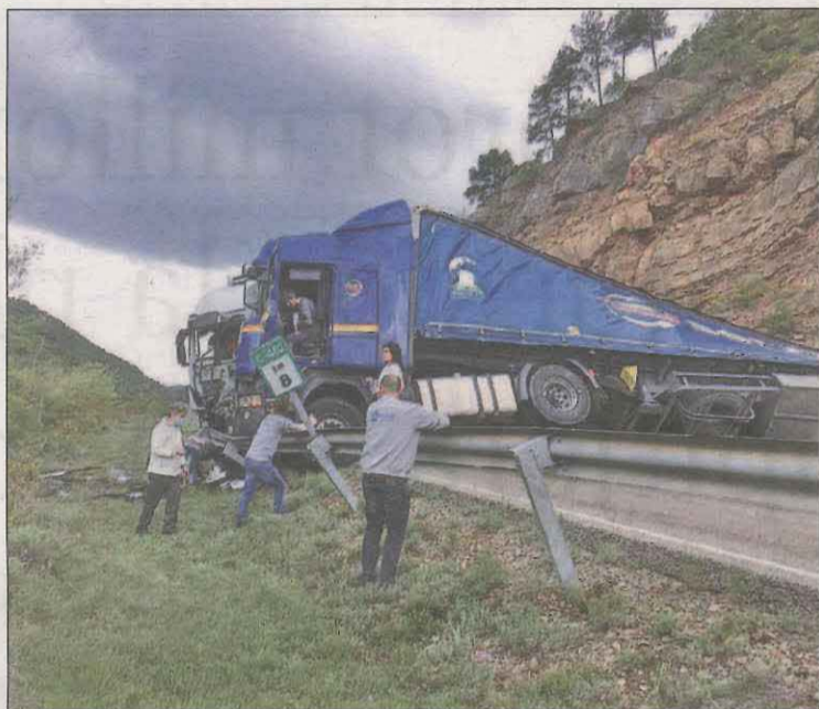
Camió accidentat a Lladurs (Solsonès) el passat divendres

Pel que respecta a les carreteres catalanes, fins al 30 d'abril han perdut la vida un total de 27 persones, un 22,9% menys que en el mateix període de l'any passat (35). Aquesta xifra està influida en part per les restriccions de mobilitat per frenar la transmissió del Covid-19, amb confinaments municipals i comarcals que han reduït el grau de mobilitat. Del total de morts, el 40% són motoristes (11), hi ha també 4 vianants, 2 ciclistes i els 10 morts restants anaven en turismes, furgonetes o camions. Trànsit alerta que pràcticament s'ha triplicat el nombre de motoristes morts a les