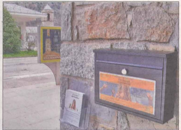
Les propostes es podien dipositar en bústies

El passat dia 27 d'abril va finalitzar el termini per presentar projectes, i en total s'han recollit 183 propostes, el que representa quasi un 20% de participació, molt per damunt del que sol ser en aquest tipus de procés.