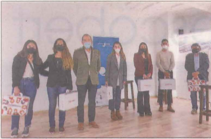
El premi està dotat amb un total de 1.500 euros