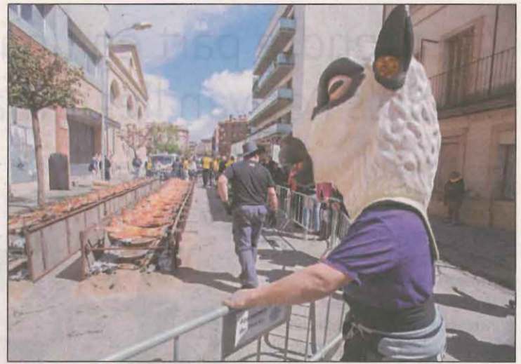
La carn de corder, protagonista ahir i avui

Ahir va tenir lloc el petit mercat firal, una mostra de productors de proximitat que s'ha dividit en dues places de la ciutat i que ha aplegat un total de 15 expositors artesans