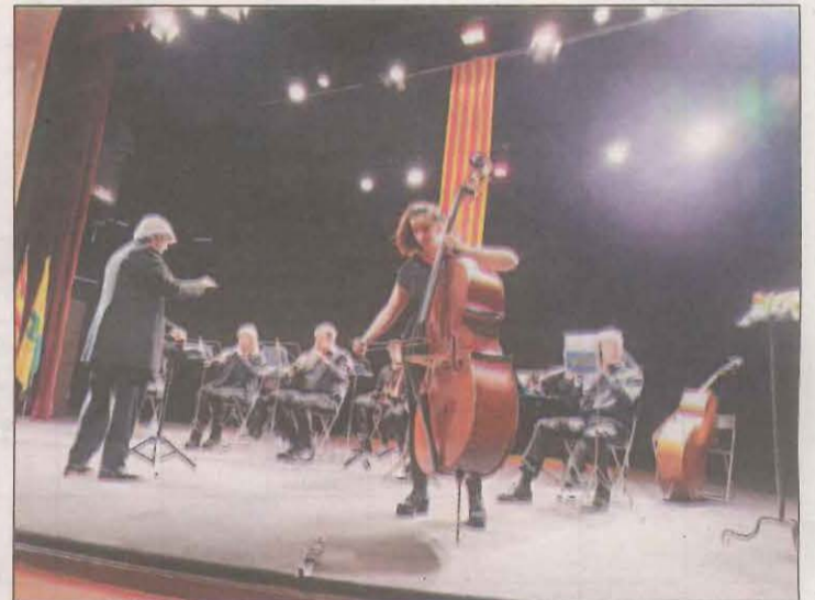
El lliurament del premi va ser al Teatre Armengol