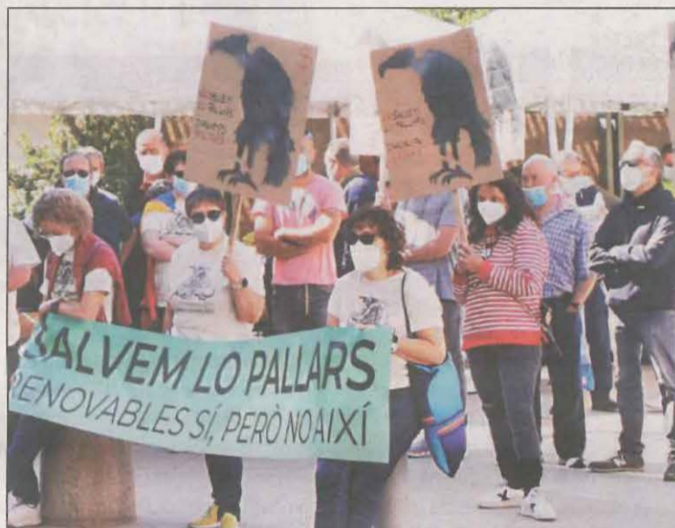
una de les entitats organitzadores