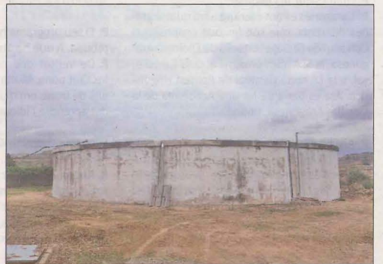
El dipòsit municipal d'aigua d'Aitona

L'Ajuntament d'Aitona va donar per finalitzada aquesta setmana l'actuació d'urgència al dipòsit municipal d'aigua amb l'objectiu de resoldre l'avaría que s'havia detectat en aquesta instal·lació. Malgrat que els treballs d'arranjament van acabar a finals de la setmana passada, fins ahir a la nit no es va garantir la potabilitat de l'aigua per al consum humà.