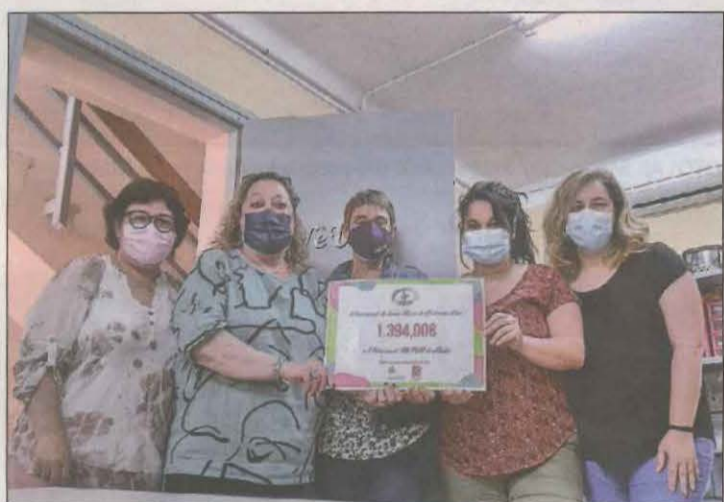
Membres de Nèvia lliuren el xec a l'entitat Refem