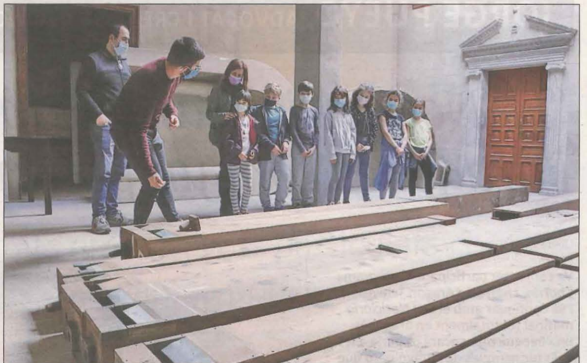
FOTO: Mar Martí / Escolars observen els tubs de l'orgue de la catedral

mateix temps que genera espais d'ombra. La zona exterior del pavelló s'ha pavimentat, amb la creació d'unes grades exteriors i s'ha solucionat els problemes de drenatge, convertint-ho en un espai on es puguin realitzar actes municipals. Les obres de millora han tingut un cost final de 270.000 euros i ha comptat amb la subvenció del 75% de l'import en el marc del projecte de Pla de Barris