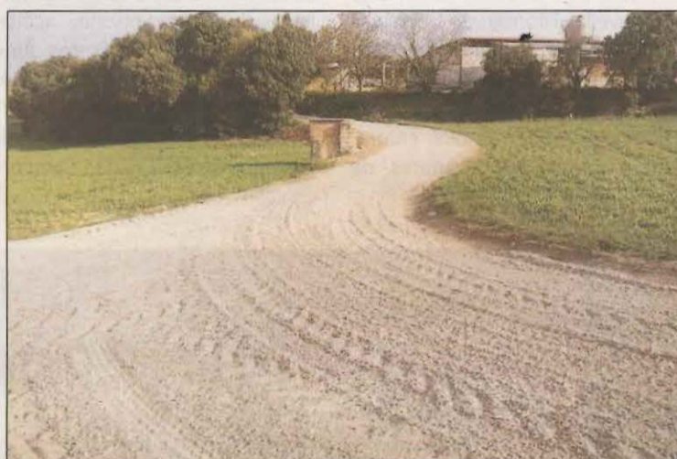
El consistori vol promoure l'ús dels camins

es van recaptar en una caminada solidària, una xerrada, una aportació de l'Ajuntament de la recaptació d'una obra de teatre i d'una farmàcia local.