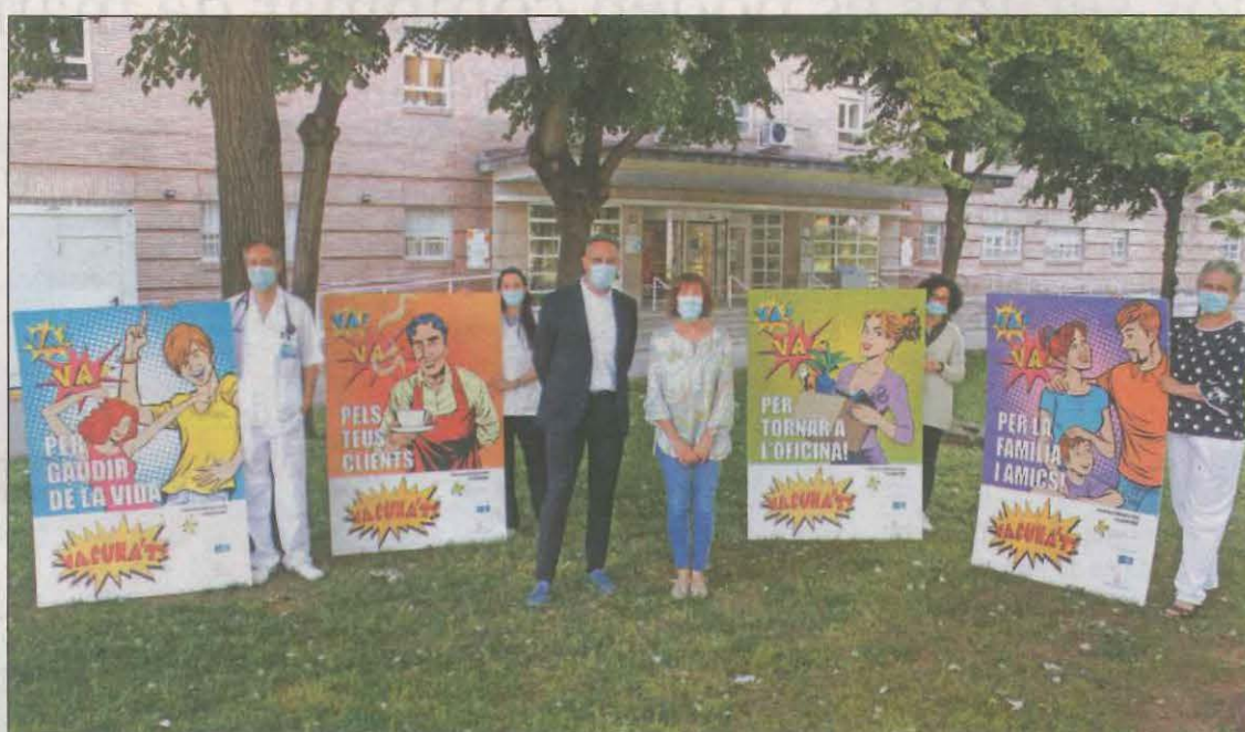
La campanya es va presentar ahir davant l'Hospital Arnau de Vilanova de Lleida