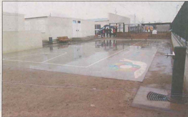
Imatge de l'escola Mont-roig de la capital de la Noguera

El conveni permetrà l'ampliació de l'Escola Mont-Roig, que va començar la seva activitat el curs escolar 2007-2008. Inicialment, la construcció de l'escola es va plantejar en dues fases. La primera fase de l'edifici va ser executada, a l'espera de la construcció de la segona fase de l'edifici, de manera que una part de l'escola està edificada, mentre l'altra es tro-