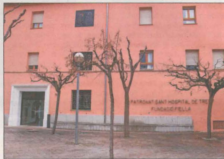
La residència va patir un fort brot de Covid al novembre

Un positiu de Covid-19 a la Residència Fiella de Tremp ha obligat a aïllar els contactes estrets que no estan vacunats. Segons el Departament de Salut, es tracta d'un resident que ja havia passat la malaltia fa uns mesos i continua ingressat a l'Hospital Comarcal del Pallars per la patologia que va determinar el seu ingrés i sense clínica Covid. Ara el centre passa a ser taronja per aquest cas, però les residències assistides i de la tercera edat de la Regió Sanitària de Lleida segueixen sense cap cas positiu de coronavirus.