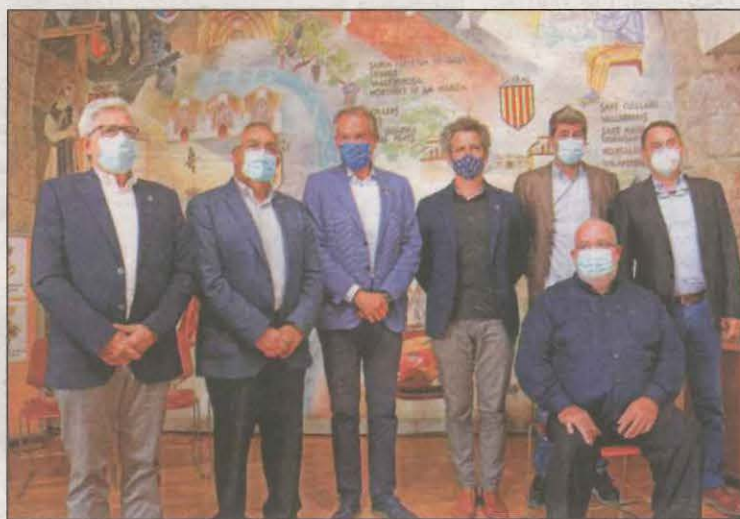
Els set presidents comarcals van escenificar ahir l'aliança

L'acord d'ERC i JxCat és vist amb bons ulls pels representants dels consells comarcals d'aquestes set comarques tarragonines, lleidatanes i barcelonines. Els esperona que el nou govern tingui més "sensibilitat" en la qüestió. "Esperem que ens facin cas i ens escoltin, som set consells comarcals, representem el 15% del territori i, amb 166 municipis, su-