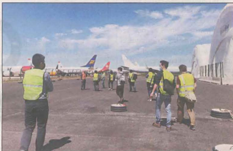
Imatge de les persones que participen en aquest curs

Aquesta setmana ha començat el curs de mecànica d'aeronaus a l'aeroport de Lleida-Alguaire. Aquest curs s'ha iniciat amb la part teòrica, que s'acabarà al mes de setembre, i continuarà llavors amb les pràctiques. Es preveu que el curs tingui una durada de dos anys.