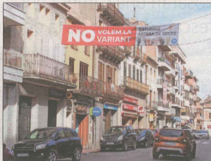
El tram de la variant d'Artesa de Segre genera polèmica

El projecte abasta el tram que va des del final de la variant d'Artesa de Segre, l'execució de la qual s'inicia enguany, fins al nucli de Folquer. L'obra consisteix principalment en el condicionament de les carreteres L-512 i C-1412b i millora del traçat, amb un carril