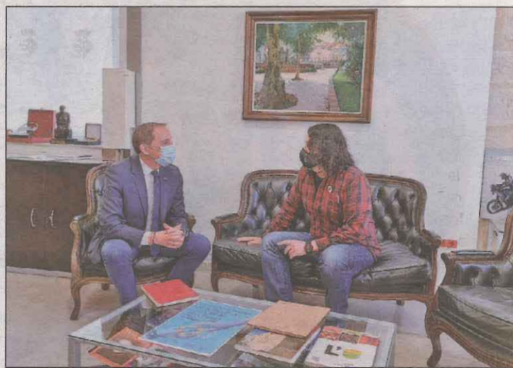
El subdelegat del Govern espanyol amb l'alcalde de Bellpuig