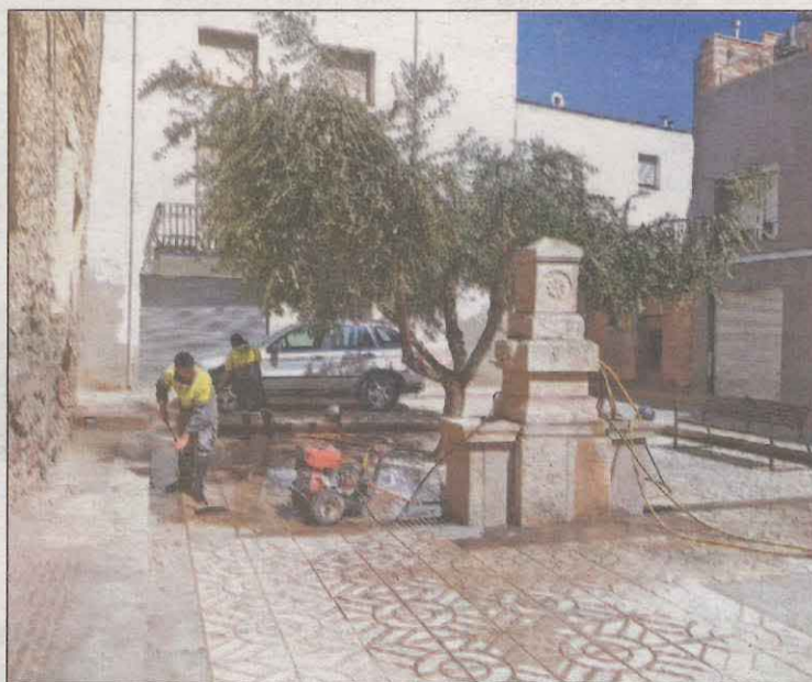
Imatge de les obres que s'hi han dut a terme