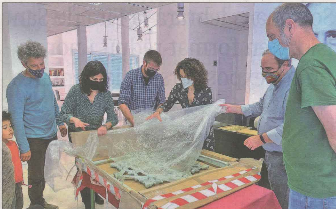
Moment en que es va rebre el tram de barana del pont on Companys va ser lliurat al franquisme

L'Ajuntament d'Agramunt ha instal·lat a l'oficina d'atenció ciutadana un tauleta de signatura biomètrica, per tal que els veïns i veïnes puguin signar amb una rúbrica manuscrita, legal i digital, tal com ho farien en paper. Gràcies a aquest sistema, les persones que no disposin d'una signatura digital o certificat electrònic, podran fer els tràmits pertinents amb la mateixa validesa legal i jurídica que donen aquests sistemes i donar així compliment a la llei que obliga a disposar de mitjans electrònics per les seves comunicacions.