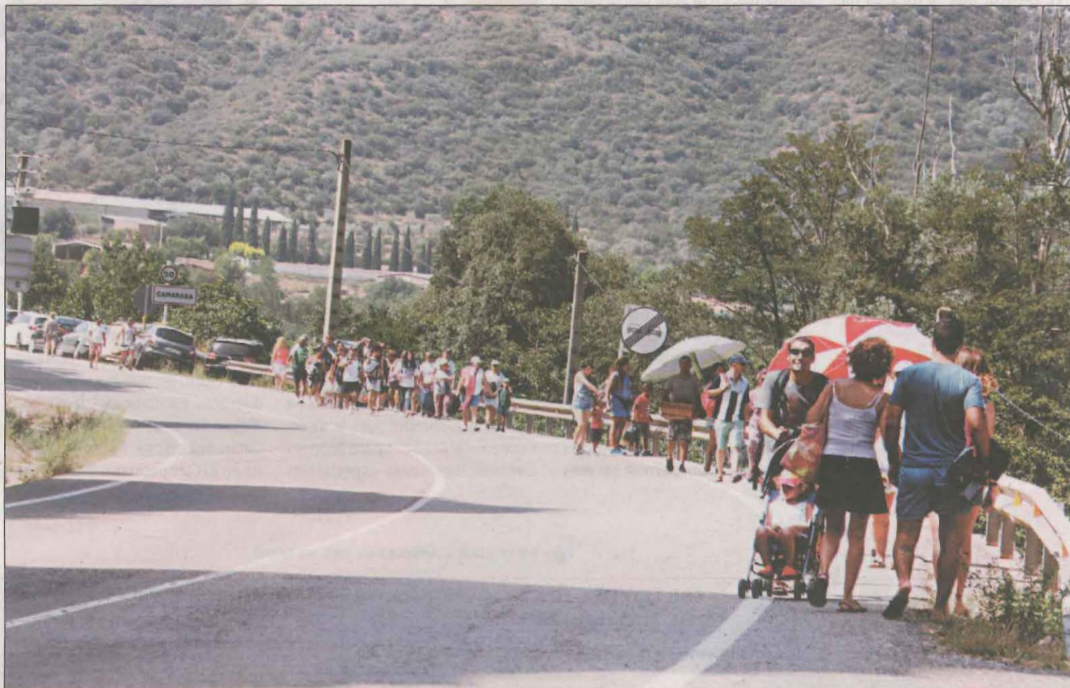
Imatge d'arxiu, d'abans de la pandèmia, de les cues que s'arribaven a registrar per accedir a la Platgeta de Camarasa, a la Noguera

Una prova que considera que va anar "molt bé", tot i que va ser un estiu marcat per la pandèmia i que, per tant, no es va rebre tota la gent que s'hagués rebut si no hi haguessin hagut les restriccions. En aquest sentit, l'alcaldesa confirma que enguany es mantindrà la mesura de pagament per accedir a la Platgeta i, de fet, des del consistori ja s'ha fet un bando per comunicar les ofertes de feina en control i condicionament de les zones turístiques i tasques de suport als serveis de neteja.