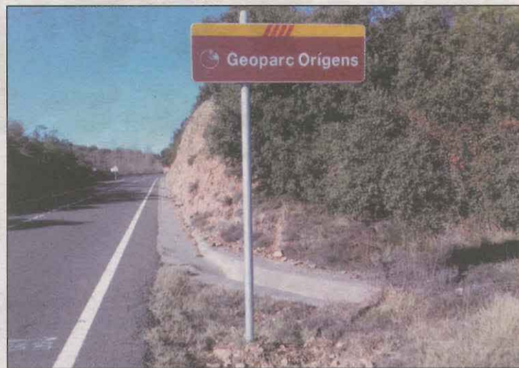
Durant dues setmanes es faran activitats

A més a més, enguany s'inclou una novetat que és la participació dels alumnes de 3r i 4t d'ESO de l'Institut de Tremp en un intercanvi virtual amb altres Geoparcs mundials de la UNESCO. En total 6