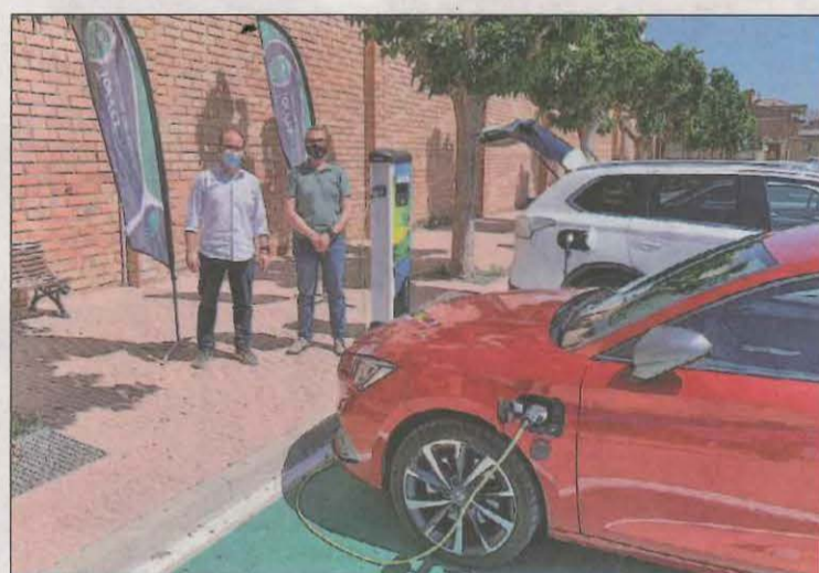
És el primer carregador públic i gratuït del Baix Segre

ble de l'energia i han visitat als camps d'aerogeneradors o un hort solar fotovoltaic.