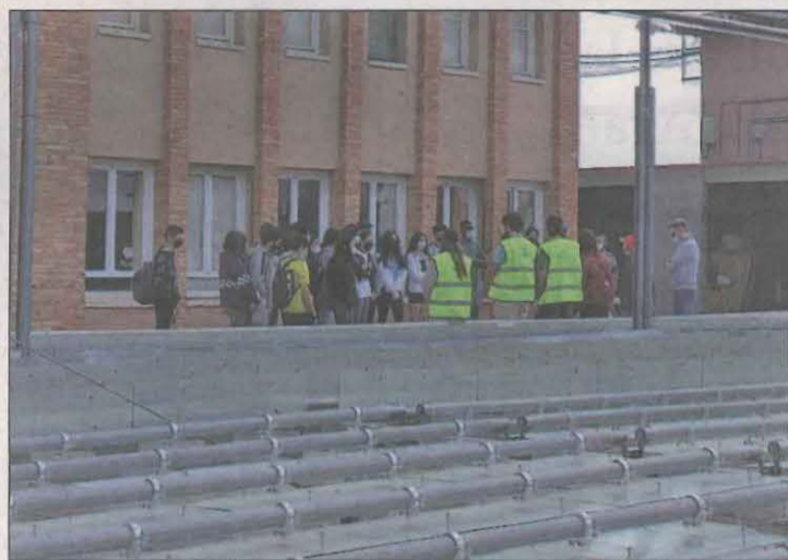
Les antigues escoles acullen el Centre d'Interpretació

Al llarg del mes de maig diversos grups han visitat Almatret dins la prova pilot per avaluar i dissenyar les visites i activitats del futur Centre d'Interpretació.