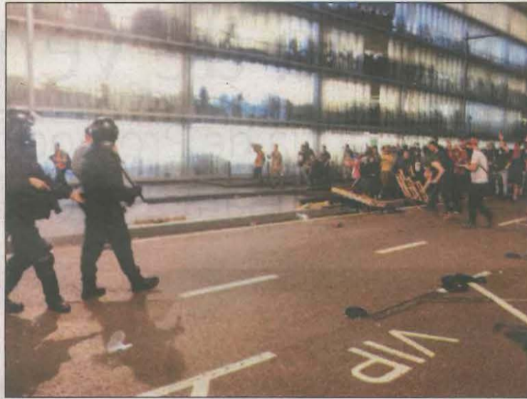
Un dels moments de la batalla campal que hi va haver

Els tres agents denunciats per l'afectat, Irídia i la fiscalia, eren agents de la Brimo que portaven llançadores de foam. Finalment, però, el jutjat ha arxivat el cas perquè no ha trobat prou elements per incriminar un sol agent del delictes de lesions. El magistrat explica que ni testimonis presen-