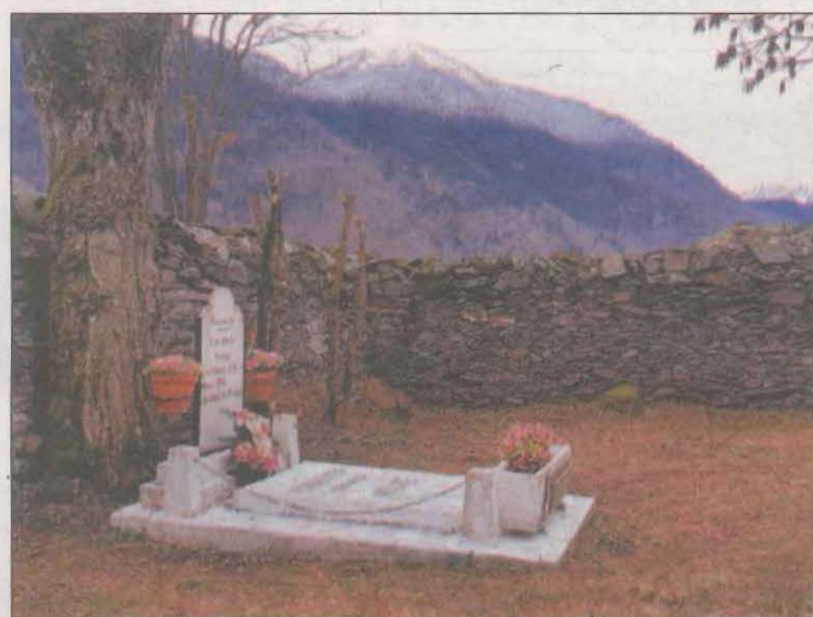
El cementiri de Teresa és el més petit de tot l'Estat