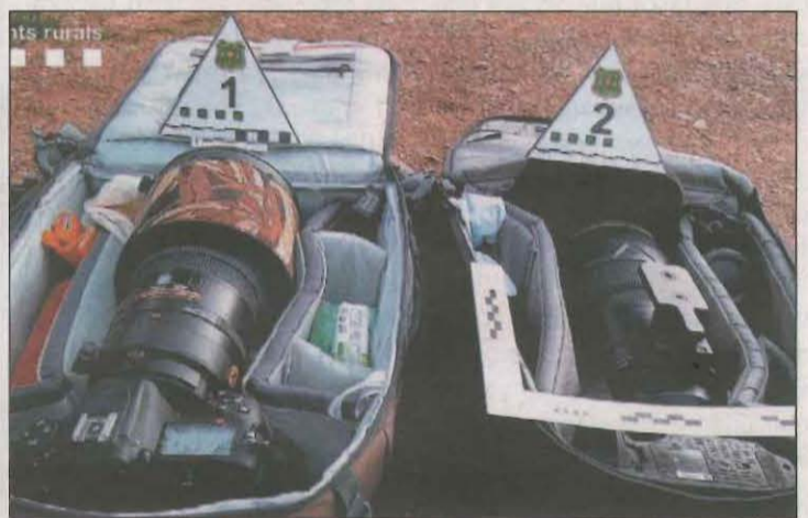
Imatge del material fotogràfic intervingut

d'emergències van ser alertats del sinistre a les 18.06 hores i el trànsit es va desviar per l'LL-11. Es van registrar 5 quilòmetres de cues. No va haver-hi ferits.