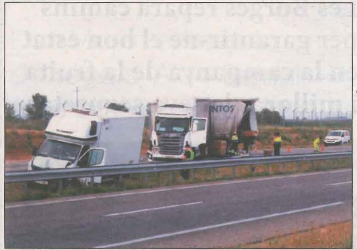
Dos dels vehicles implicats en el sinistre

feia molt temps que se seguien els passos dels suposats implicats en aquesta causa contra la salut pública. Segons va poder saber LA MAÑANA, als domicilis dels arrestats es van trobar grans quantitats de droga i diners. Una de les detencions es va realitzar al carrer Bonaire de Lleida, on també es va fer un registre, de la mateixa manera que en un altre habitatge de l'avinguda Catalunya i a Cappont. A Balaguer l'operació es va centrar en diversos punts de la ciutat, com els carrers Bellcaire, Bellmunt, Girona, Sanahuja, Sant Crist o la Plaça Pau Casals, entre altres llocs.