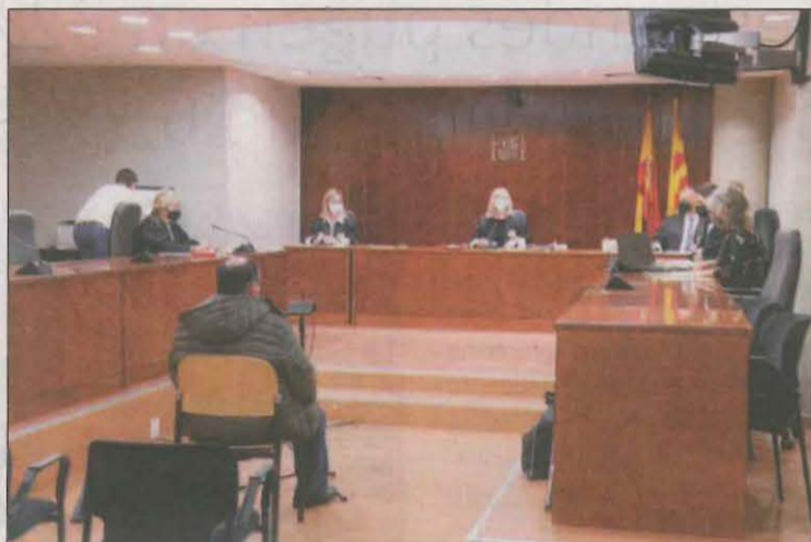
Moment del judici a l'Audiència Provincial de Lleida

L'acusat, de llavors 67 anys, va negar els fets, però la víctima, que en tenia 27, va relatar per videoconferència trobades sexuals amb ell a canvi de diners o de begudes. Va afegir que "no ho volia fer, però no sabia dir que no". La Fiscalia va augmentar la petició de pena i, a més de 8 anys i 9 mesos de presó per un delictes continuat d'abús sexual, demana 3 anys més per haver tingut relacions sexuals amb una persona amb discapacitat a canvi de diners. En total, 11 anys i 9 mesos de presó, a 10 anys de llibertat vigilada quan surti de la presó i que indemnitzis la víctima amb 5.000 euros. L'acusació particular va de-