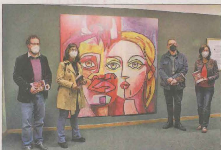
Imatge de la presentació de la mostra al Museu