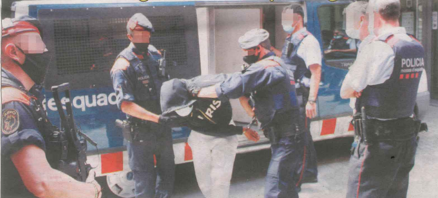
Los arrestados el martes declararon ayer en los juzgados desde primera hora de la mañana