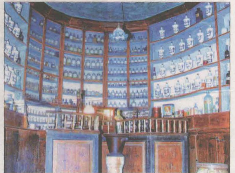
Imatge de l'interior de la farmàcia

L'objectiu és convertir la Farmàcia Tomàs Piñol en un espai visitable, així com recuperar, preservar i estudiar el patrimoni que