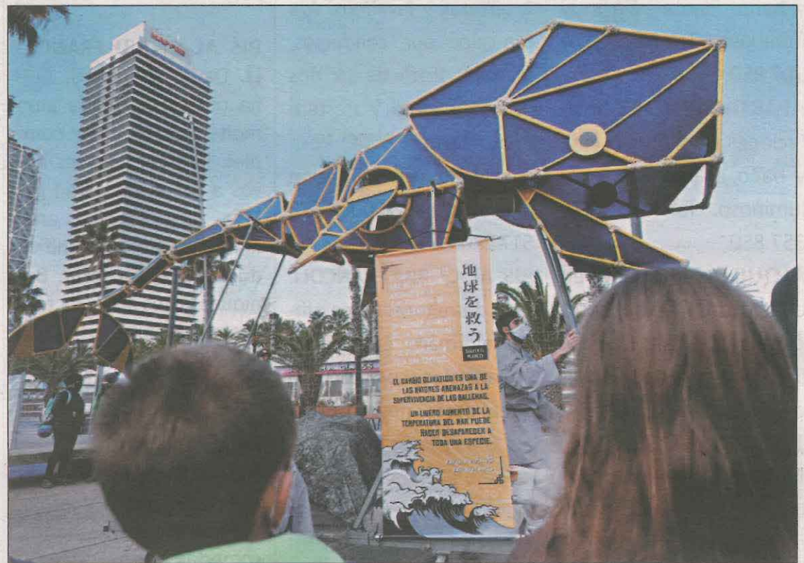
La companyia lleidatana escenifica aquesta obra el cap de setmana a Dinamarca

Kujira significa balena en japonès i amb la seva posada en escena es pretén posar de manifest i denunciar l'existència encara avui dia de la pesca furtiva