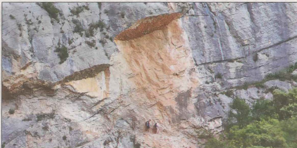
Imatge del despreniment que hi va haver fa sis mesos al congost de Mont-rebei

Les obres que s'hi duran a terme seran les estrictament necessàries per estabilitzar les roques i restablir el pas, i seran finançades per la Diputació, que ha fet l'estudi tècnic. Les empreses que treballaran en la restauració s'han compromès a iniciar les obres els pròxims dies.