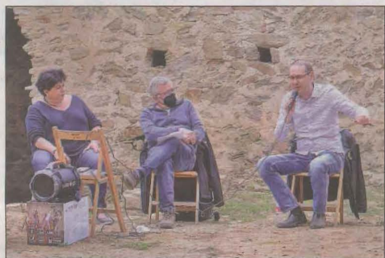
L'autor lleidatà durant la presentació del llibre