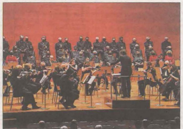
El públic va gaudir amb la Novena de Beethoven

Així, encara que de moment no s'ha plantejat una segona part que continuï l'estudi "es podria fer perfectament, n'hi ha moltes".