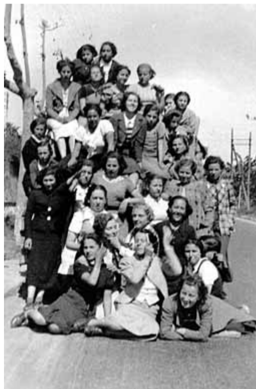
La bandera a l'Arxiu Nacional. Un grup de dones de l'Aliança en una visita al front el 1938. Acte de lliurament d'una bandera oferta per l'Aliança a Vilanova de Meià el maig de 1938