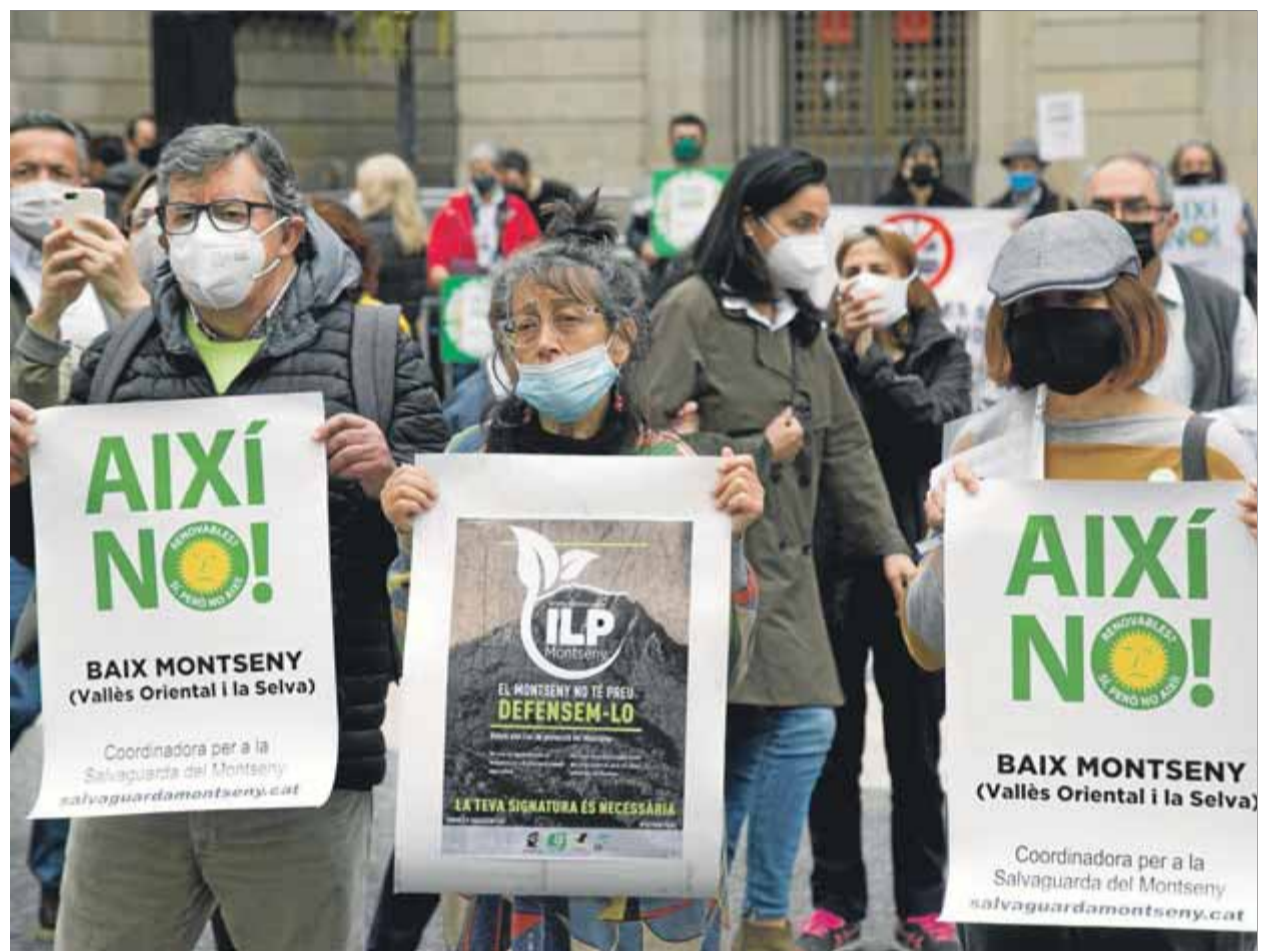
Representants d'una quarantena d'entitats de diferents punts del territori han explicat la seva problemàtica