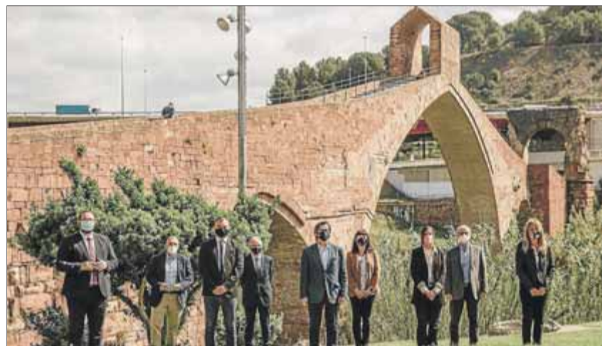
Els nou alcaldes signants de la Declaració de Martorell