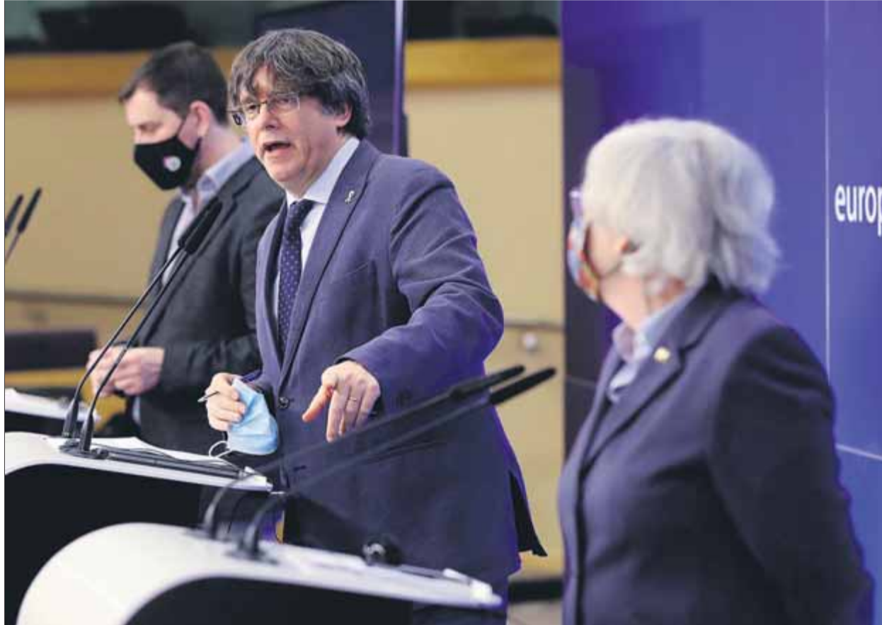
Comín, Puigdemont i Ponsatí, en una roda de premsa a l'Europarlament

El Suprem va informar ahir que el TJUE es pronunciarà sobre el cas, però no va detallar quines de les set preguntes ha acceptat o si es reformularan. De fet, els experts s'inclinen per pensar que els jutges europeus les canviaran perquè no estan gaire ben