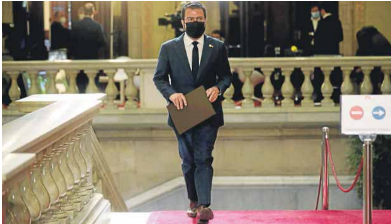
Aragonès -aquí, el dia del seu segon intent d'investidura- es va tornar a reunir ahir amb Junts al Parlament

Les dues parts reprendran avui les converses, matí i tarda, parlant de qüestions de l'àmbit econòmic i institucional, que engloba Interior, Justícia i Exteriors. Ahir al matí,