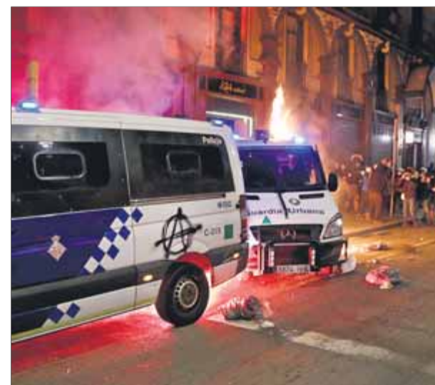
El furgó incendiari en la protesta per Hasél

los a la presó. L'Audiència sosté que tots sis (amb la catalana posada en llibertat dividida) van actuar en grup en els actes vandàlics, i amb el foc al furgó van veure l'agent a dins i sabien el risc que hi havia, és a dir que com a mínim "hi ha un dol eventual", que s'haurà d'aclarir en la instrucció i el judici. ■