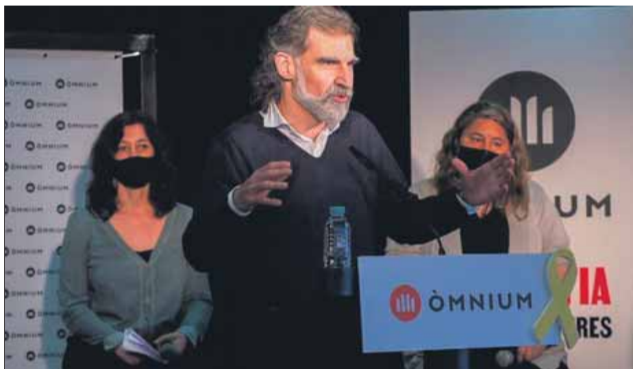
Jordi Cuixart, president d'Òmnium, en un acte amb represaliats independentistes

Per contra, Cuixart assegura que no demanarà perdó i que ho tornaria a fer. "En algun moment, Espanya haurà de reflexionar i preguntar-se: