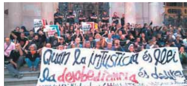
La protesta a les escales del Palau de Justícia, el 2018 ■ A.S.

Torra va ser condemnat pel TSJC, i confirmat pel TS, a un any i mig d'inhabilitació i a pagar 30.000 euros. Té pendent un segon judici per desobediència pel mateix motiu per un jutjat penal. ■