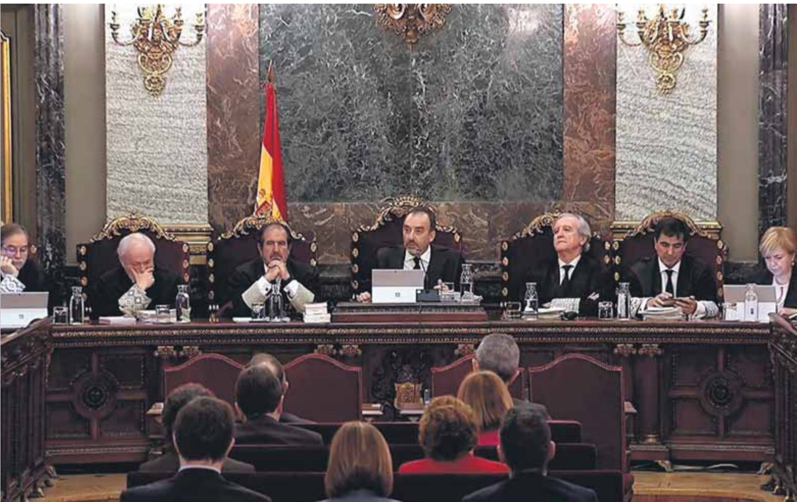
Els set magistrats del Tribunal Suprem que van jutjar els dotze independentistes catalans, a Madrid el 2019