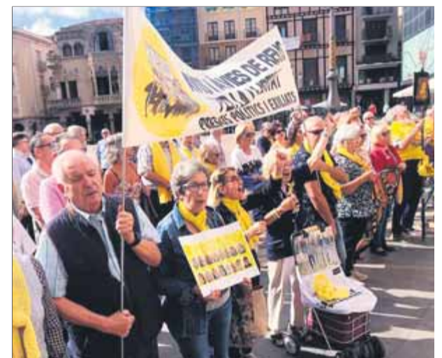
Una de les concentracions dels Avis i Àvies per la República a Reus, abans de la pandèmia ■ BARTOLOMÉ PLUMA

El manifest conclou exigint als tres partits independentistes que "formin govern, que es deixin de barallar i que es posin a treballar per aconseguir la independència del nostre país, que per això vam aconseguir el 52% dels vots en aquestes eleccions". ■