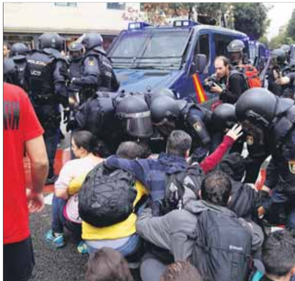
La policia espanyola, l'1-0 a Barcelona