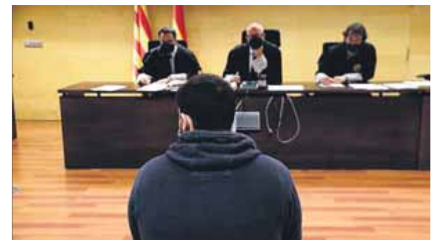
D'esquenes, l'acusat de participar en els disturbis postsentència a Girona de la nit del 19 d'octubre