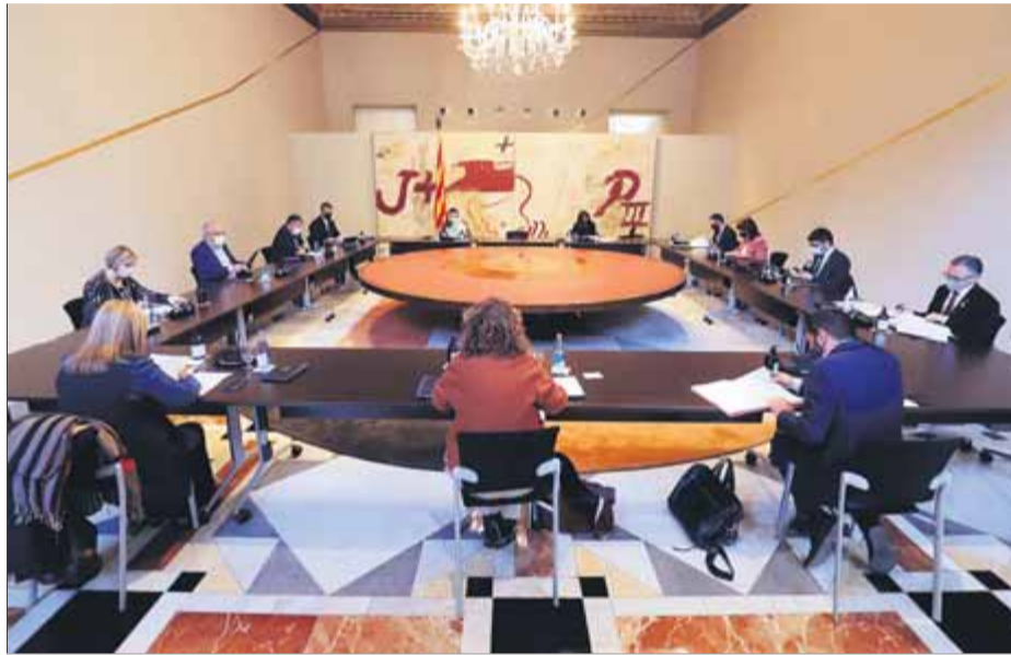
Un Consell Executiu del govern en funcions de la Generalitat ■ ACN

Aquesta aportació de 230 euros per habitant en comparació amb els 80 de mitjana del global de les autonomies la ressaltava també el grup parlamentari d'ERC en defensa de l'esforç financer d'una Gene-