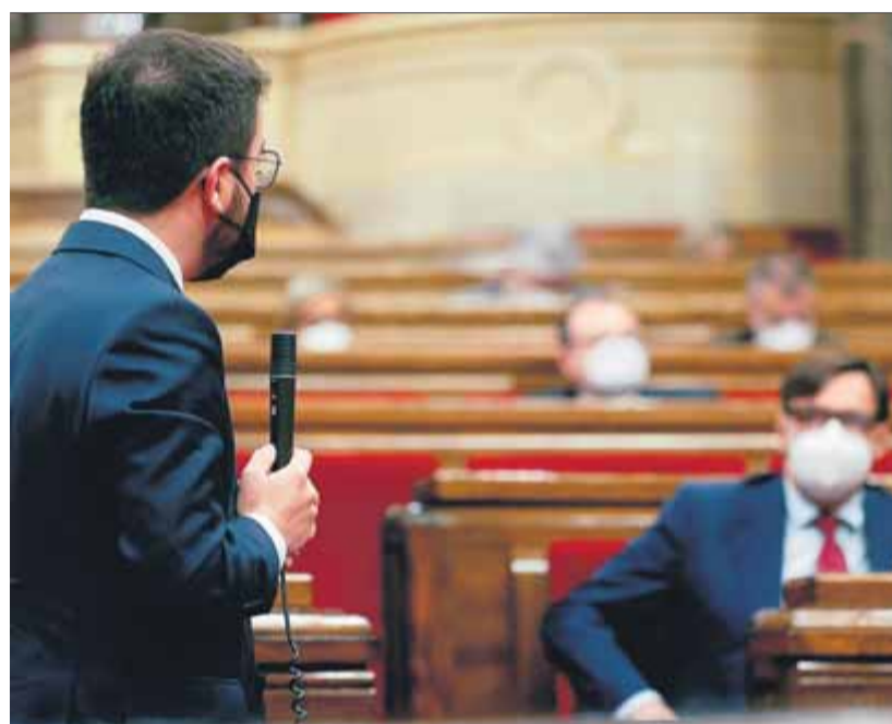
Pere Aragonès respon a Salvador Illa durant la sessió de control